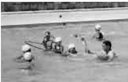
昨年の子ども水泳教室