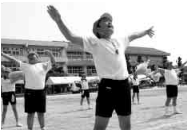
頑張りましたね応援団（八積小）

一松小は5月21日、八積小は28日に春の運動会を開催しました。両校とも晴天のもと行なわれ、応援合戦にはじまり、入学して間もない1年生も頑張って競技に参加しました。親子競技も実施され保護者も楽しい1日を過ごしました。