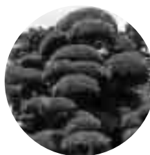
村の木：ラカンマキ 昭和45年11月3日指定

診療科目 内科・小児科 診療時間午後8時～午後11時 消防署裏 ☎ 24-1010 夜間急病診療テレフォン案内 ☎ 24-1011 午後7時～翌午前6時まで