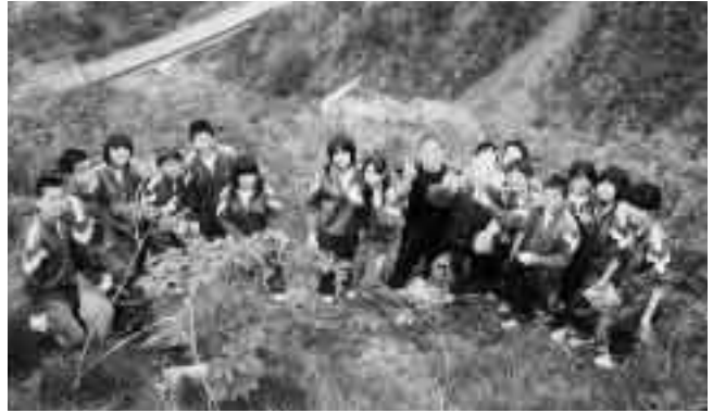
植樹した木と一緒に記念撮影

おじいさん、おばあさんたちは生徒たちのフルートなどの演奏に時間の経つのを忘れ聞き入りました。生徒会によるソーラン節はアンコールが出るほどの盛況。最後はみんな、七夕飾りを作り、笹の葉にかざりました。