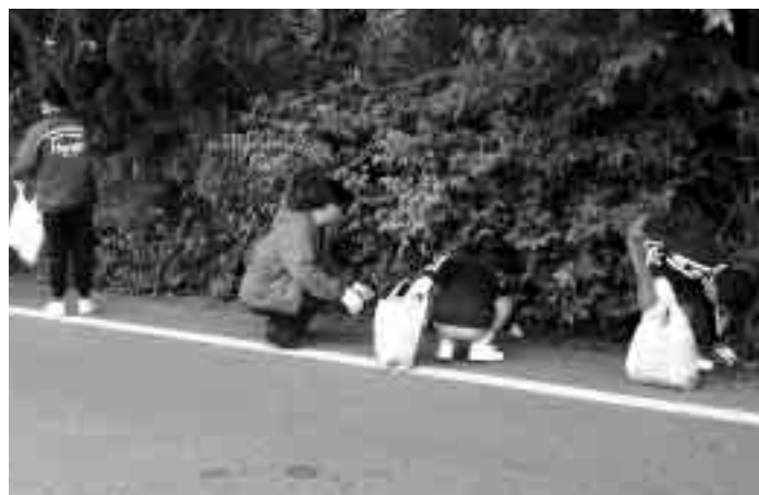
見えないところにも捨てられています

また、今年は長生中学校の3年生50人と教師10人がボランティアで八積駅周辺のごみを拾ってくれました。