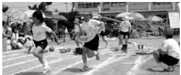
一生懸命走りました（一松小）

一松小は5月21日、八積小は28日に春の運動会を開催しました。両校とも晴天のもと行なわれ、応援合戦にはじまり、入学して間もない1年生も頑張って競技に参加しました。親子競技も実施され保護者も楽しい1日を過ごしました。