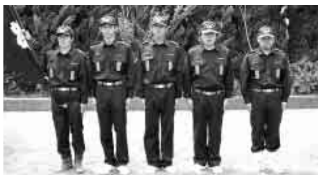
優秀賞 第1分団第1部（金田）