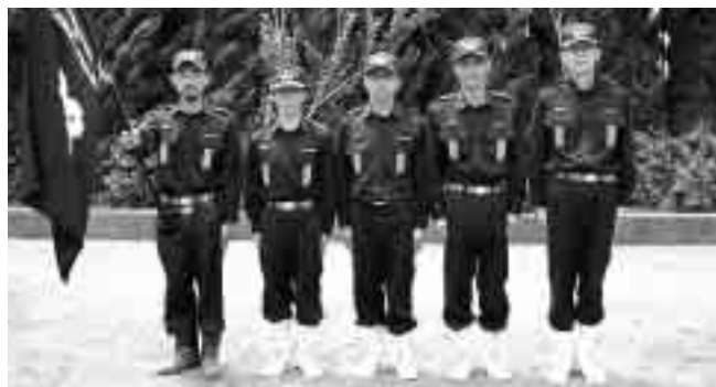
最優秀賞 第1分団第5部（信友）