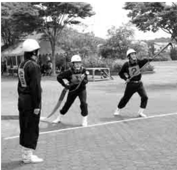
各部の練習の成果が競われました

結果は第1分団第5部（信友）が7年連続で最優秀賞を獲得し、その他の成績は以下のとおりです。