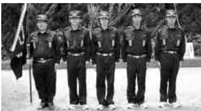
優良賞 第2分団第5部（原・小泉・高谷原）