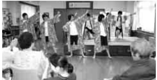
生徒会役員によるソーラン節