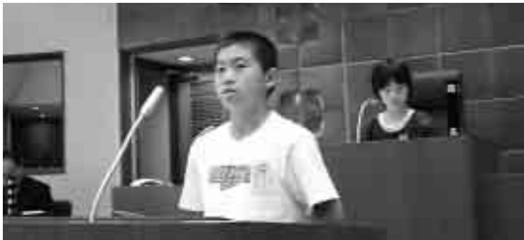
緊張気味に質問を行いました

小学生議会は村の将来を担う児童に住みよい街づくりへの意識を高め、村の政策や議会に対して理解を深めてもらうことを目的として実施されました。