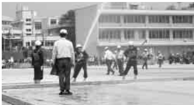
見事な操法を披露してくれました