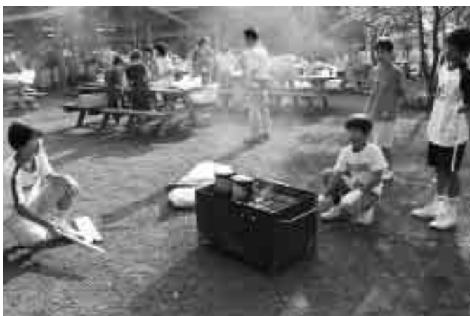
協力して火の番をします