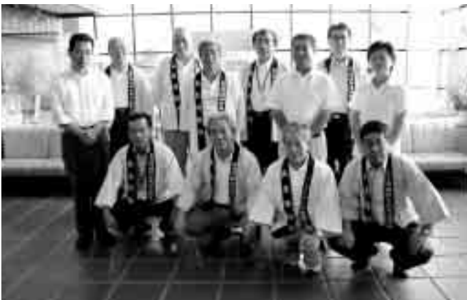
村長、助役と関係者が役場にて記念撮影