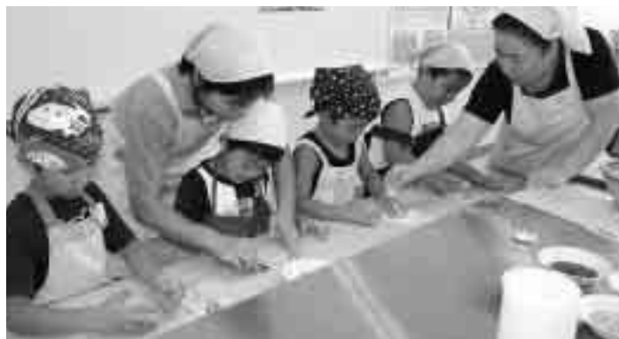
ちびっ子クッキング(一松保育所年長組)