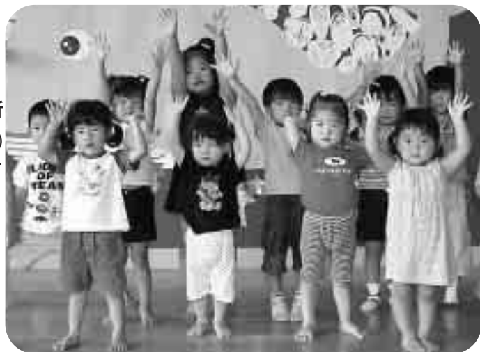
僕たち私たちのためにも協力してね(一松保育所園児)