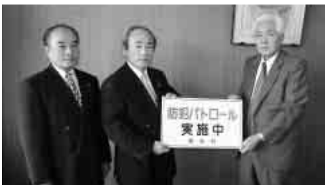
ライオンの役員から狩野教育長へ手渡されました