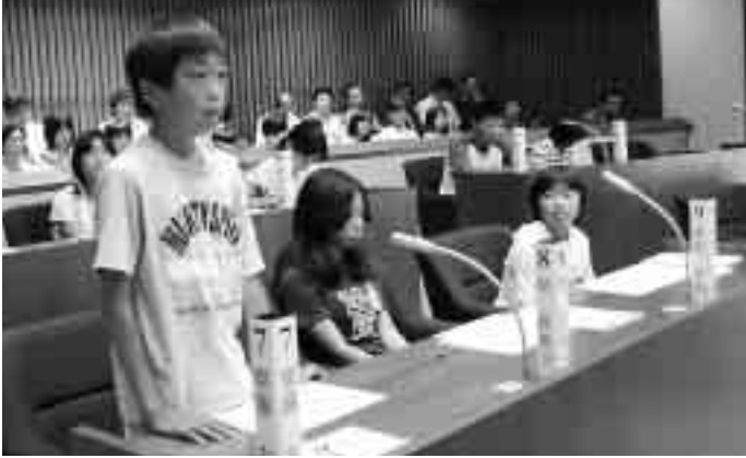
核心を突いた鋭い質問が相次ぎました