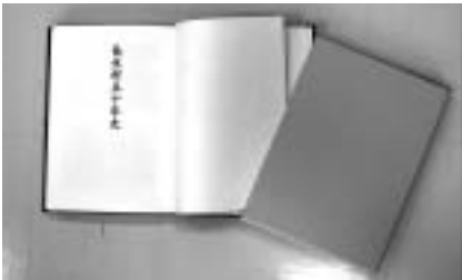
長生村の歴史に触れてみては？