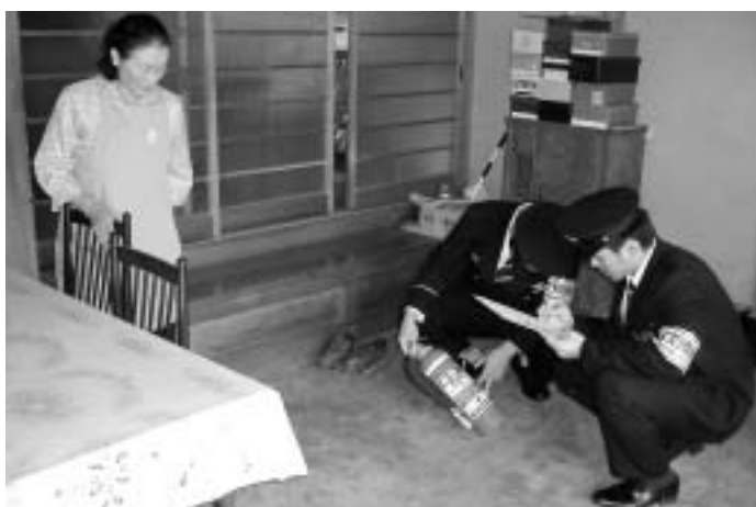
消防署職員による査察風景