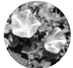
村の花：ハマヒルガオ 平成5年11月3日指定