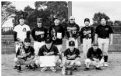
優勝した大村フェニックス