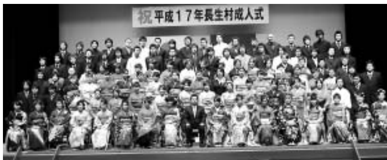
昨年度の成人式より