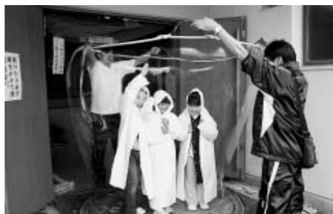
シャボン玉の中から見ると世界は？

また、シャボン玉のコーナーでは、中に人が入れるような大きなシャボン玉まで作られました。