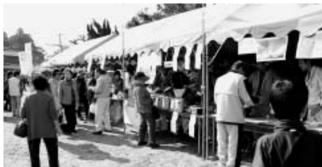
美味しいものがたくさん（産業まつり）