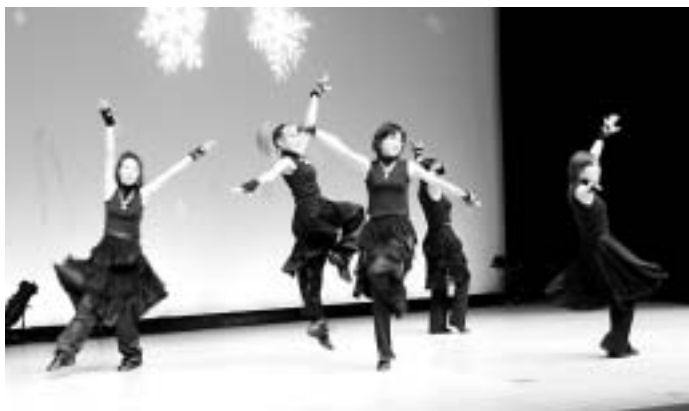
ジャズダンスサークルによる華麗な踊り

今年も文化祭と産業まつりが11月3日に文化会館、中央公民館、旧庁舎跡地で行われました。