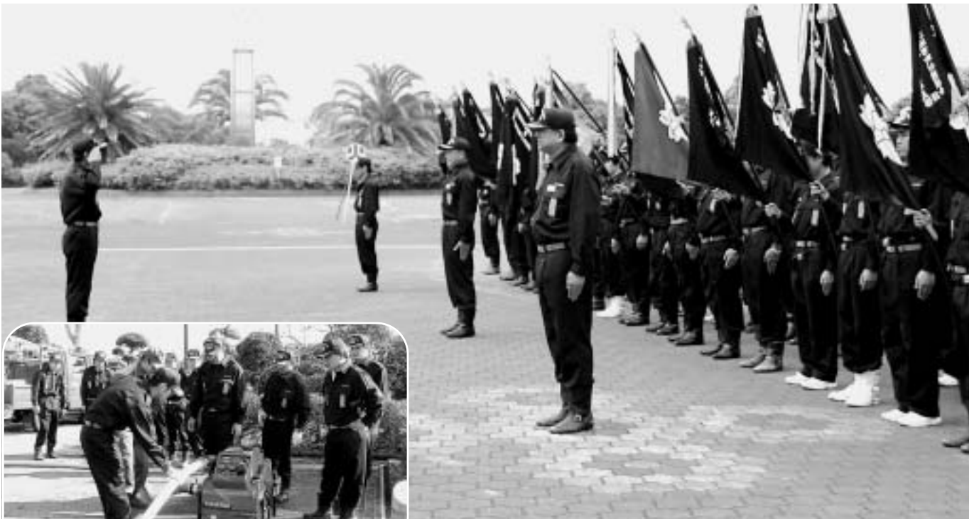
整列する消防団員（写真左は昨年の秋季訓練・下は操法県大会）