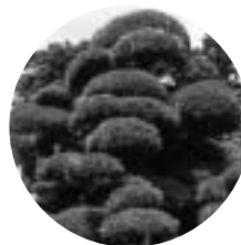
村の木：ラカンマキ 昭和45年11月3日指定