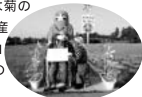
かかしコンテスト最優秀作品

文化会館ホールでは小中学生や公民館クラブ員による発表が行われ、大勢の観衆の前で練習の成果を十分に発揮しました。公民館では菊の展示などが実施され、また、産業まつりでは今年もかかしコンテストが開催され、22点の力作が出展されました。