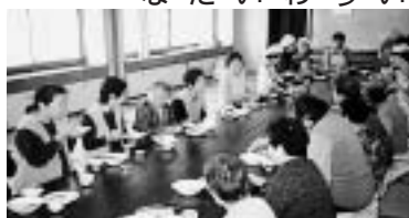
ながいき教室で試食