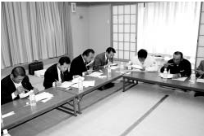
今年のお米の味は？