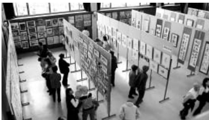
中央公民館に展示された書道、絵画