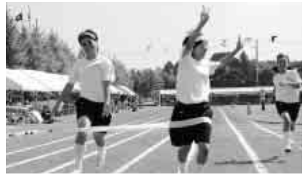
やったね、1位でゴール