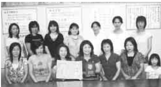
広報委員のみなさん