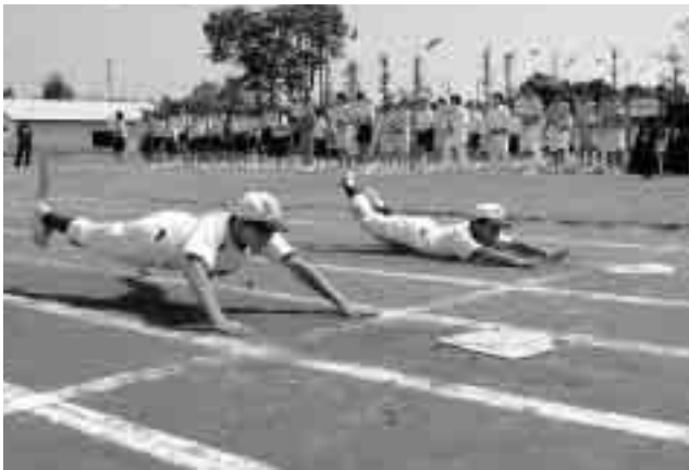
部活動パレードで、野球部のヘッドスライディング

午前の部、最後には部活動パレードが行われ、各部活動それぞれの持ち味を生かしアピールをしていました。