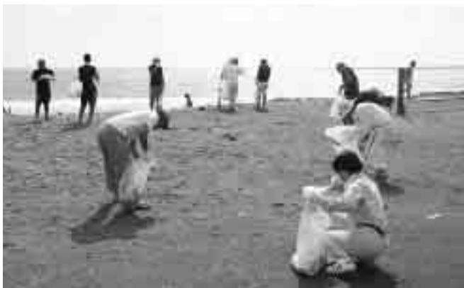
みんなで協力してゴミ拾い