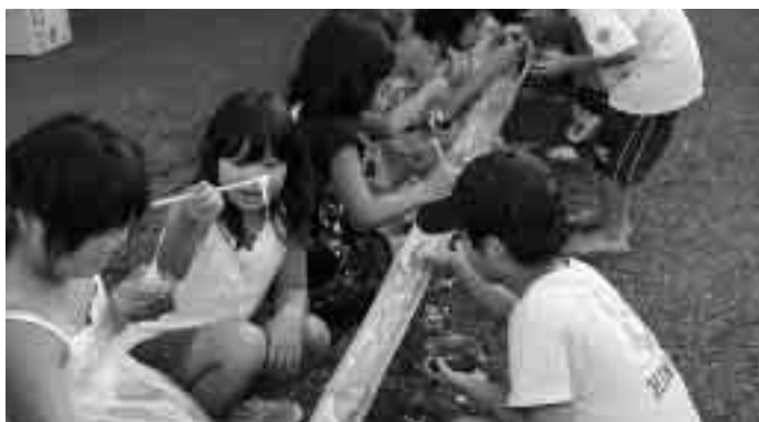
流しそうめんで涼しげな夕食

これは、3学童保育所の児童の交流とお互いに助け合い、協力する心を養うことを目的として行われたもので、きもだめしや花火などが賑やかに行われ、夏休みの楽しい思い出となりました。