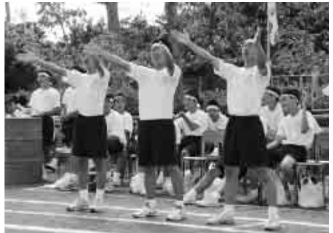
応援団の力強い声が響きます