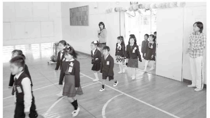
希望に満ちて笑顔で入場です（高根小）