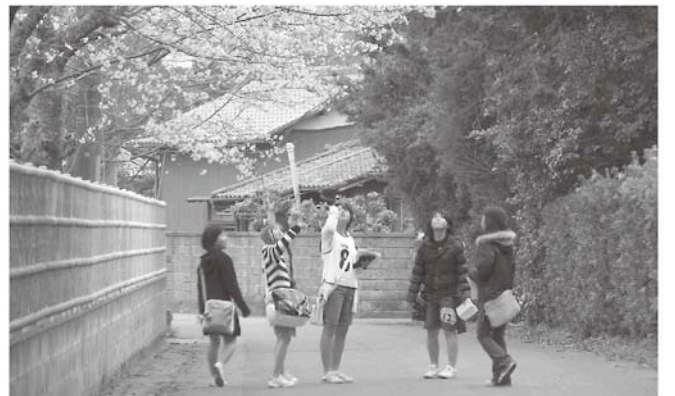
歩いて村の春を見つけました

今年は33チーム、152人と昨年を大幅に上回る参加者でした。あいにく天候には恵まれませんでした。八積小を元気にスタートし、藪塚地区、鶉沼堰などおよそ6kmを3時間かけて歩きました。長生村の春を感じることができました。