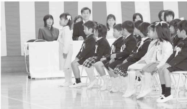
大きな声で「はいっ！」とお返事ができました（八積小）