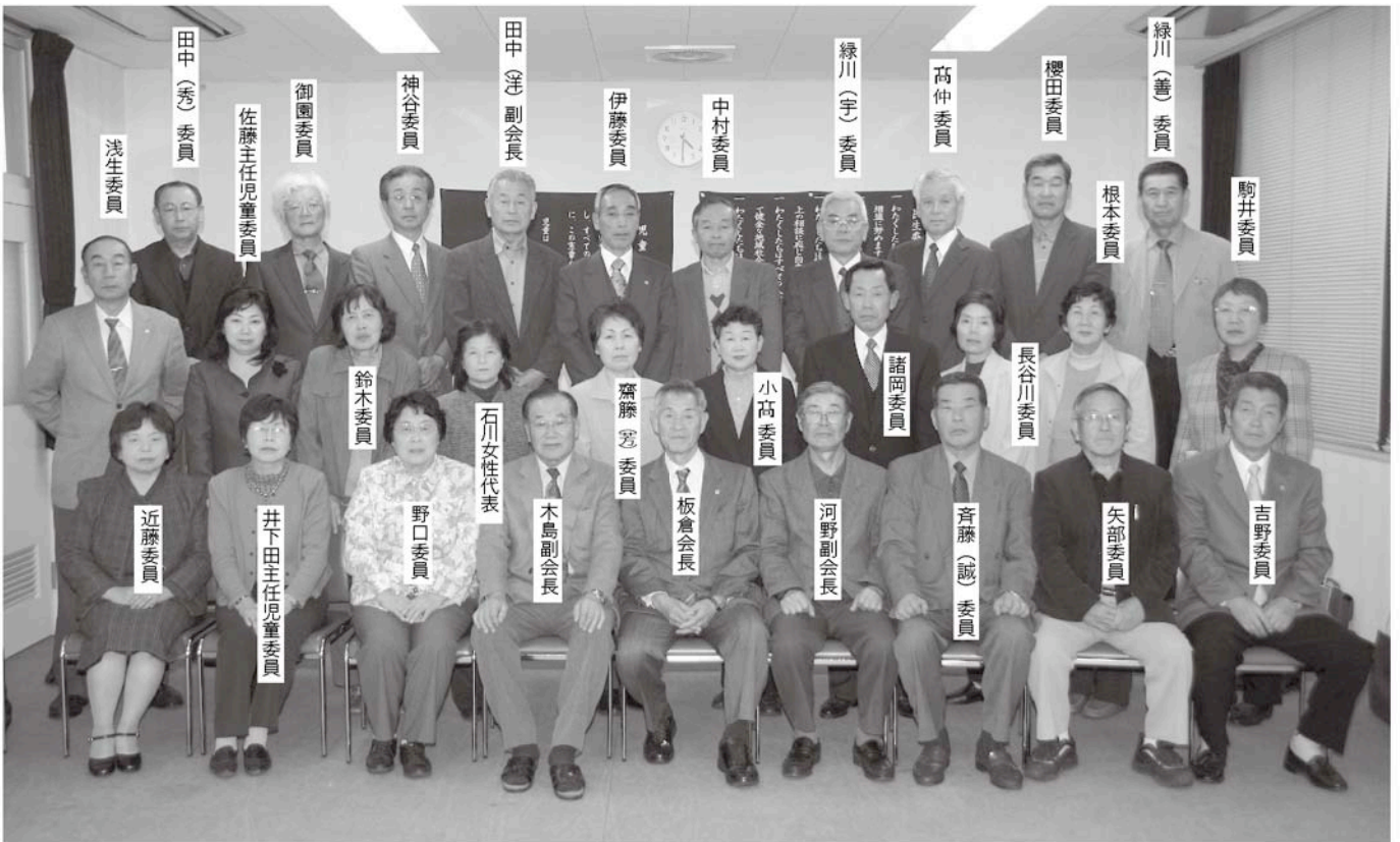
長生村民生委員・児童委員