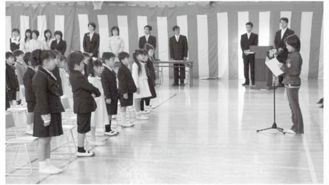
在校生から歓迎のことが贈られました（一松小）

期待と不安で胸がいっぱいの様子でした。在校生のお兄さん、お姉さんをお手本に早く学校生活に慣れるといいですね。