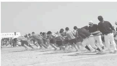
今年も熱戦が繰り広げられます