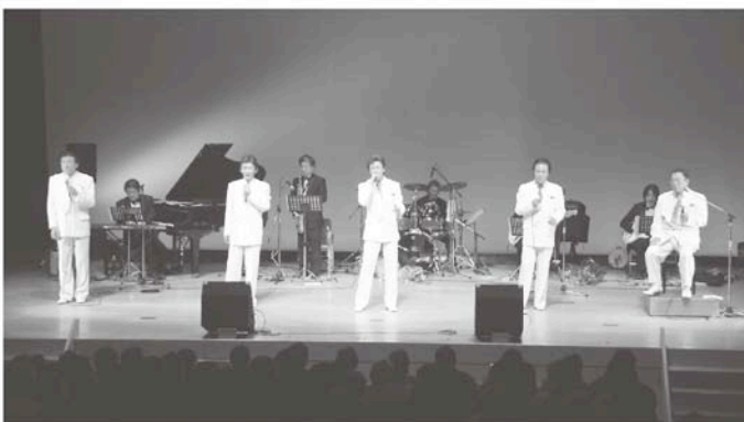
数々のヒット曲が披露されました