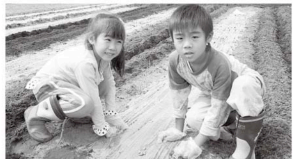
はやく大きくな～れ、収穫祭が楽しみです

当日は家族連れなど約300名がお越しになりましたが、残念ながら雨のため種植えは6月8日に延期となり、農作業体験としてトマトの収穫を楽しみました。皆さん大切に落花生の種を植え、10月の収穫が待ち遠しいといった様子でした。