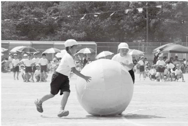
二人で息を合わせて大玉ころがし(八積小)