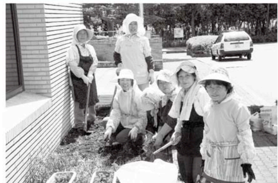
いつもきれいなお花をありがとうございます

更生保護女性会の皆さんは、心豊かに生きられる明るい社会を目指し、海岸清掃などの各種ボランティアへの参加や子育て支援などの活動を行っています。