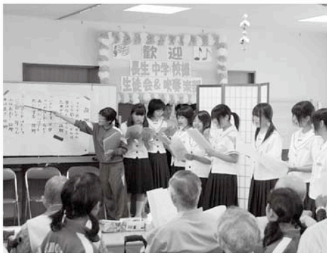
施設の皆さんと一緒に歌いました