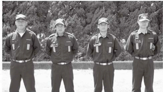
優秀賞第1分団第3部(藪塚・水口・北水口・金谷台・長生団地)