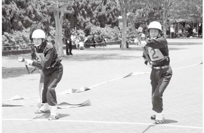
訓練の成果を十分に発揮しました

大会当日は晴天に恵まれ、昼夜を問わず消防活動に携わる消防団員が日頃の訓練の成果を発揮し、各部ともすばらしい操法技術を披露しました。第1分団第5部(信友)が2年ぶりに最優秀賞を収めました。6月28日に長柄町で開催される長生支部消防操法大会に村を代表して、第1分団第5部と第2分団第3部(新田・曾根・市ヶ谷)が出場します。