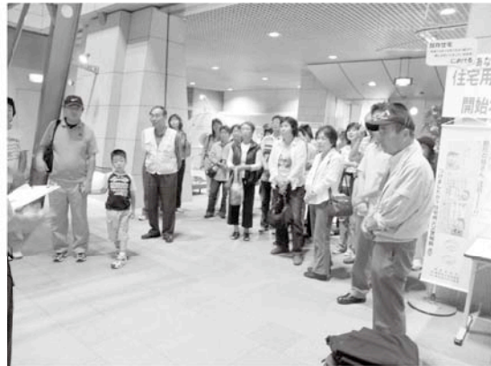
尼ヶ台南部自主防災会の研修風景(本所防災館にて)