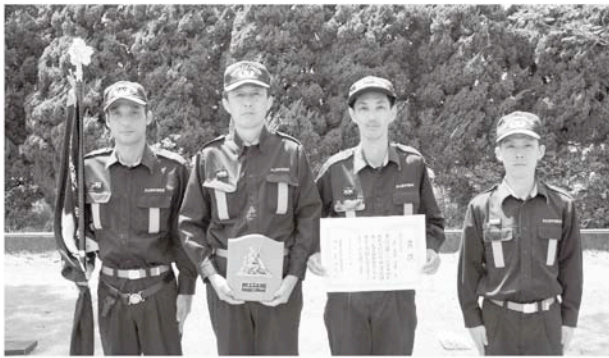
最優秀賞第1分団第5部(信友)