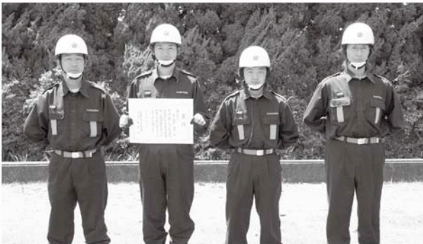
優良賞第2分団第4部(中之郷・新屋敷・小橋)