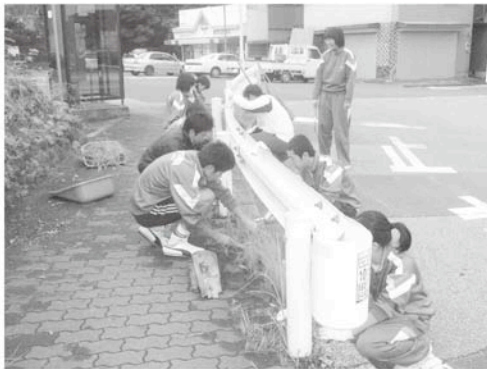
八積駅前を清掃する長生中の生徒達

6月16日、社会福祉法人長生会だるまさんにて長生中学校の生徒達が、ボランティア活動の一貫として「ふれあい会」を開催しました。