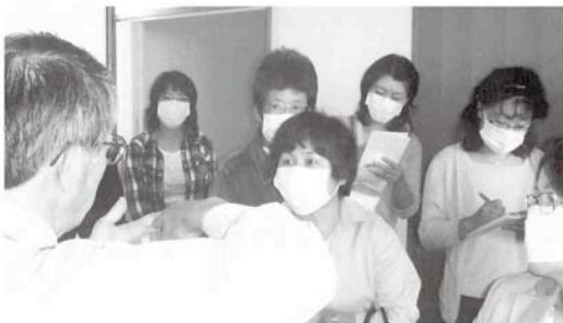
施設長から施設の概要を聞く様子