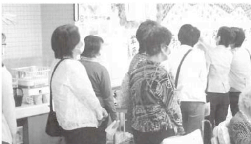
まきの木苑を視察しました