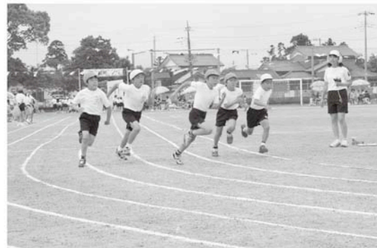
さあ一齐にスタート、勝利は誰の手に(一松小)