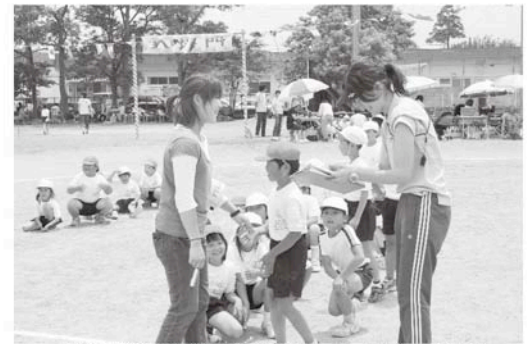
児童引渡訓練も実施されました(一松小)