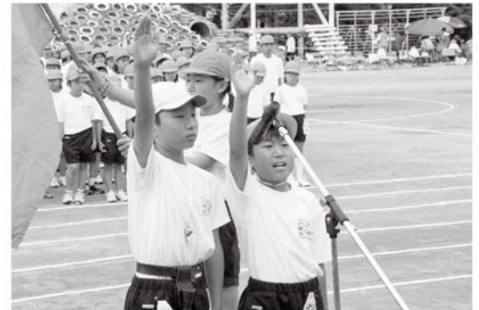
団長の選手宣誓、戦いの始まりです(八積小)