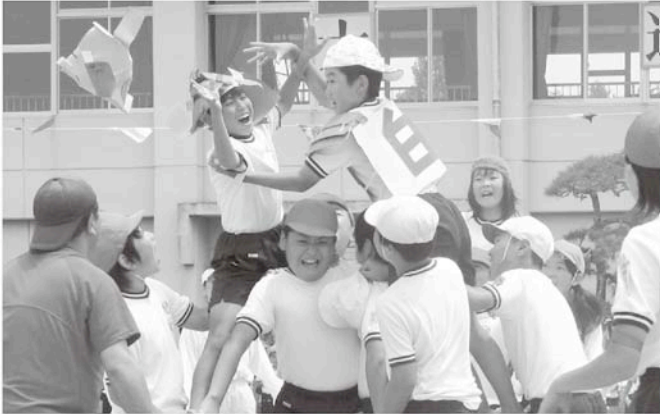
大将同士の戦い、ついに決着(高根小)

5月23日、各小学校にて運動会が開催されました。 紅組、白組応援団長の選手宣誓から始まり、リレーや騎馬戦、綱引きと選手全員が健闘しました。競技の中には地域の人に参加できるものや親子で参加できるものもあり、会場にいるすべての人が思い出に残る一日となりました。