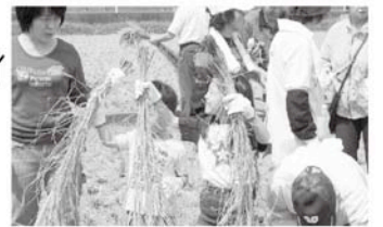
アイガモ栽培のお米がとれました！ 8

稲刈り体験後、昼食のアイガモ栽培の新米おにぎりに舌鼓をうち、収穫祭を堪能しました。