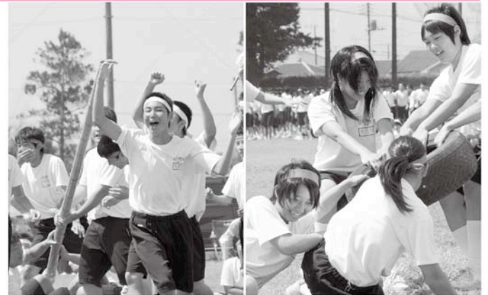
男女ともに熱い戦いが！

9月5日、第49回長生中学校体育祭が晴天のもと行われました。生徒それぞれが若き力を存分に発揮し、競技に応援にと各チーム心をひとつに勝利に向かって熱い戦いが繰り広げられました。男の戦いも、女の戦いも、気迫に溢れ、生徒のみなさん並びに応援に来られた家族のみなさんも思い出に残る体育祭となったことでしょう。