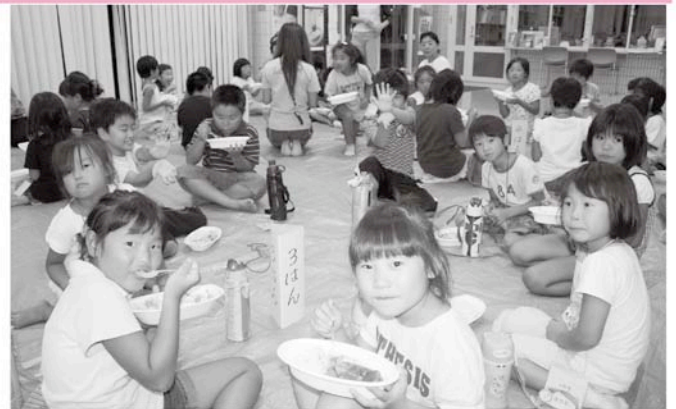
みんなで食べるカレーおいしいね

みんなで夕食のカレーを食べ、きもだめしや花火を体験、そしてお泊りと楽しい夏の思い出ができました。