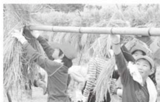
おだげにして天日乾燥