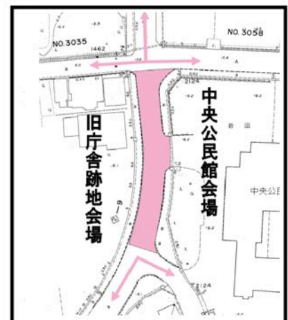
公民館前道路見取り図