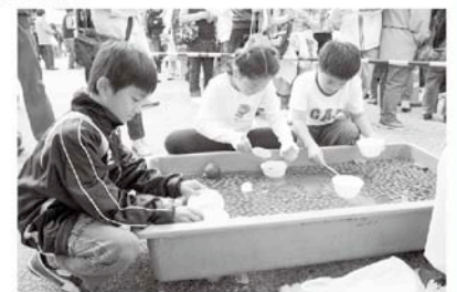
ミニトマトすくい