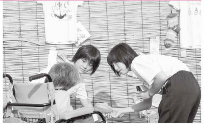
屋台での景品選びのお手伝い

夏祭りも大変盛り上がり、来場した人もボランティアの皆さんも楽しい時間を過ごしました。