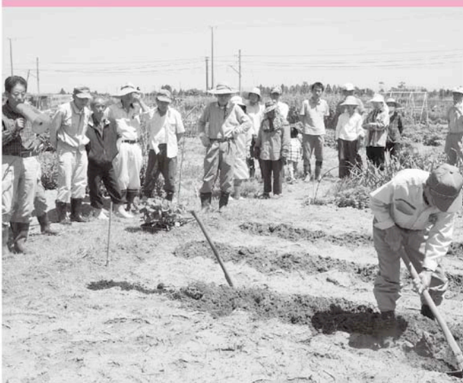
さすがは組合員の皆さん作業もスピーディーです