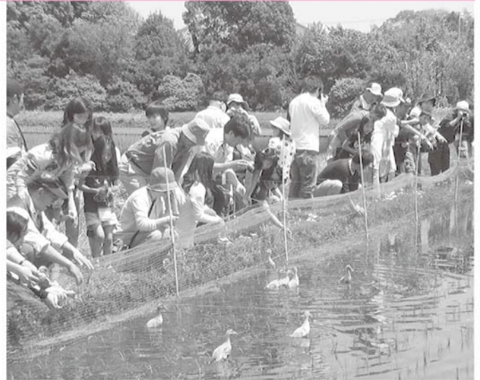
そっと優しくアイガモを放しました

また、放鳥後にはアイガモ栽培米の試食会や農産物の直売などが行われ、お土産を手にした放鳥式は終了しました。