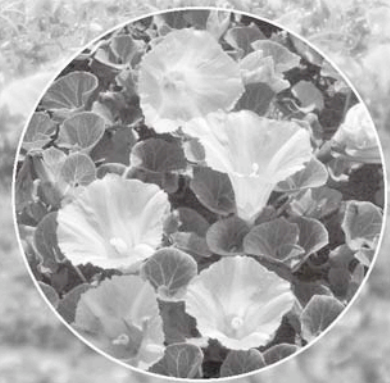
村の花『ハマヒルガオ』