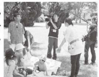
楽しい雰囲気の中クイズが出題されました