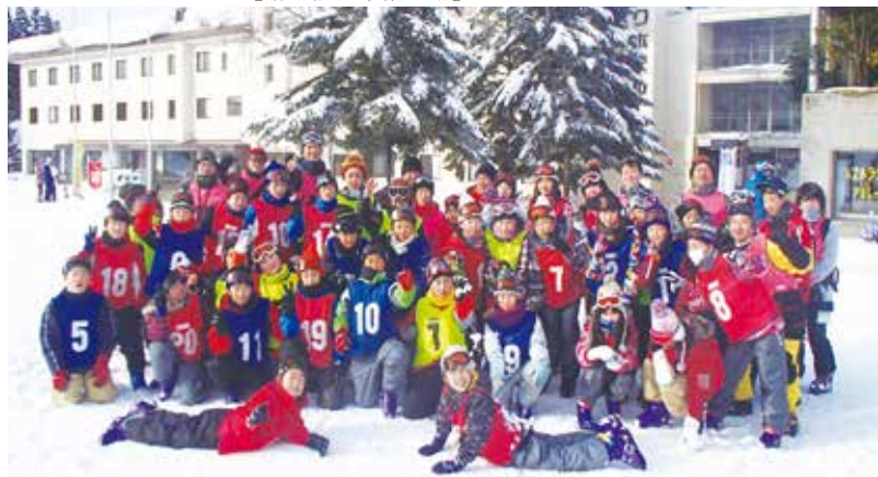
【交流会のみんなで記念写真】