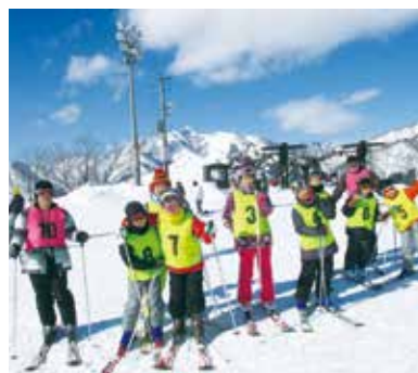
【上手に滑れました】