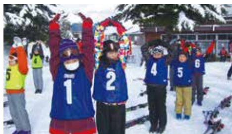
【滑る前に準備運動】

1月23日から25日の3日間、長生村青少年相談員連絡協議会主催による「子どもスキー交流会」が、新潟県の湯沢パークスキー場で行われました。当日は、穏やかに晴れた天気の中で、子ども達は元気にスキーを楽しみました。また、宿泊先での生活やレクリエーションを通して交流を深め、新しい友達ができるなど、子ども達にとって、思い出に残るものとなりました。