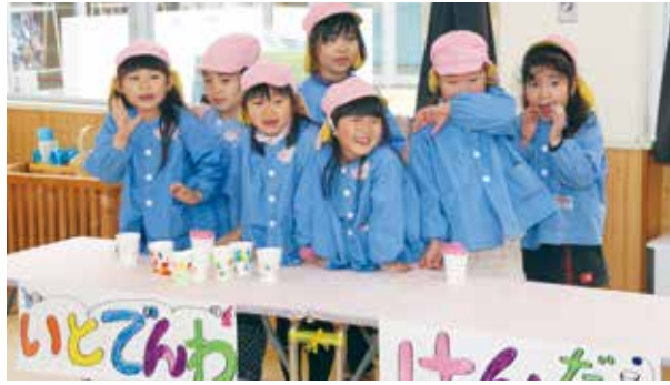
【お客さん呼び込む店員さん(八積保育所)】

1月21日に八積保育所、2月3日に高根保育所で、元気な子ども達に迎えられ、村長が一日保育所長に就任しました。どちらの保育所も、村長と記念写真を撮ったあと、お遊戯を楽しみ、一緒にお昼ごはんを食べました。