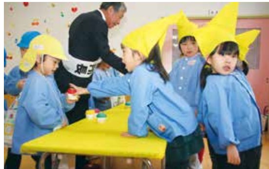
【村長と一緒に買い物(八積保育所)】

八積保育所では、村長と一緒に「お店屋さんごっこ」をしました。子ども達は、お買い物を楽しんだり、店員になって、おもちやを販売しました。