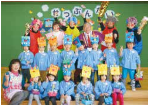
【鬼と一緒に記念写真(高根保育所)】

高根保育所では「せつぶんかい」が行われ、鬼のお面を被った子ども達は、村長と一緒に豆まきを楽しみました。