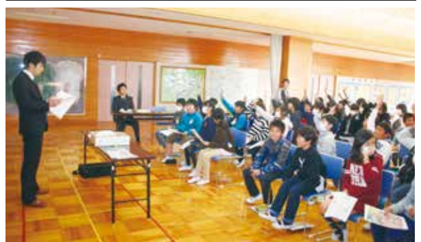
【質問形式で行われた租税教室】

最後に、中川会長は、「薬物の誘いがあった時は、断る勇気が何より大事。もしそのようなことがあったら、家族や先生、警察に必ず相談してください。」と話しました。