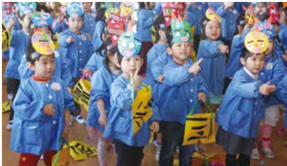
【リズムに合わせてダンス(高根保育所)】

1月20日、高根小学校で役場税務課職員による「租税教室」が行われました。「租税教室」は、児童たちに税金の仕組みを理解してもらうために、6年生を対象に各小学校で毎年行われています。初めに、ビデオを観ながら、もしも税金がなくなってしまうと、普段の生活がどう変わってしまうのか学びました。