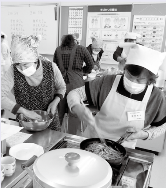
【調理実習に取り組む参加者の皆さん】

見た目の彩りも美しく、野菜がたっぷりとれるため、参加者の皆さんに、大変好評でした。