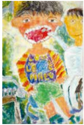
【小学校図画の部銀賞】