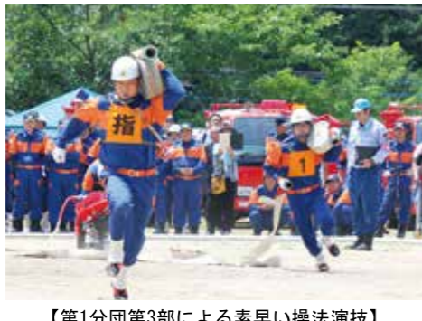
【第1分団第3部による素早い操法演技】

長生村からは第1分団第3部（水口・北水口・長生団地・藪塚・金谷台）と第1分団第5部（信友）が小型ポンプ操法の部に出場しました。