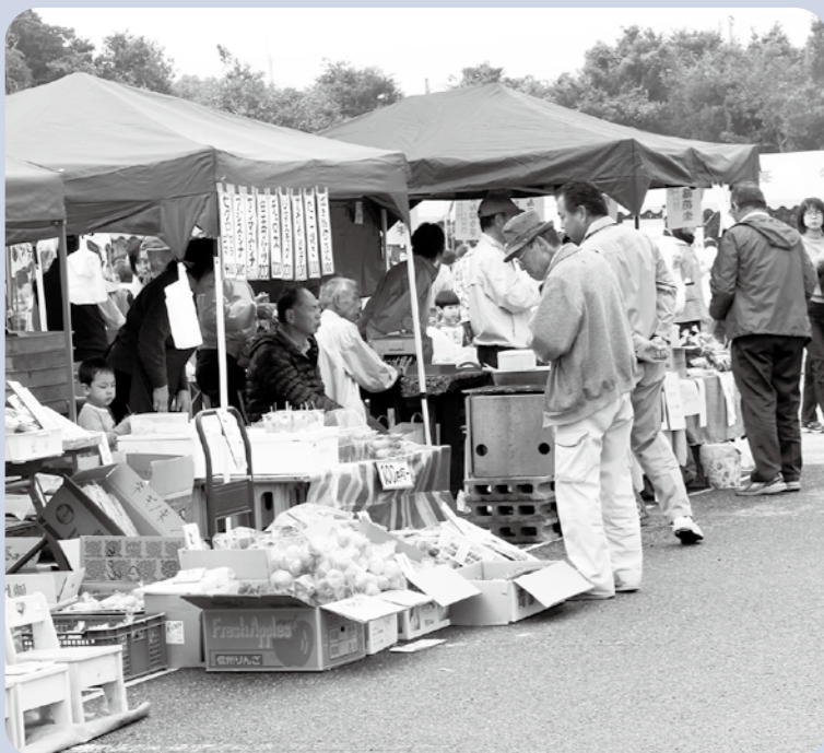
【第28回産業まつりの様子】