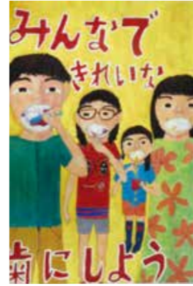
【小学校ポスターの部銅賞】