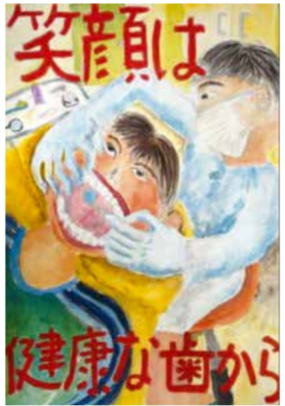
【小学校ポスターの部金賞】