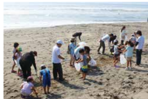
【みんなで協力してごみを集めました】

7月11日、一松海水浴場で一松小PTA主催による海岸清掃が行われました。 前日までの雨がうそのような好天に恵まれ、参加した児童と保護者、教職員226人は約1時間かけて、海岸に打ち上げられた小枝などのごみを集めました。 また、海岸清掃終了後はレクリエーションとして宝探しが行われました。