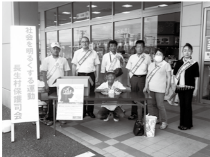
【保護司会と更生保護女性会のみなさん】