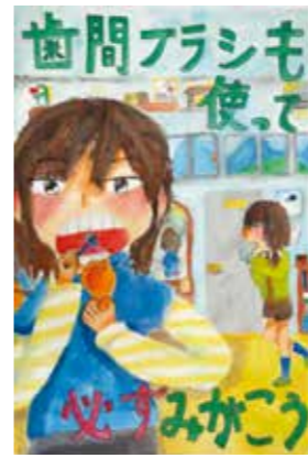
【小学校ポスターの部銀賞】