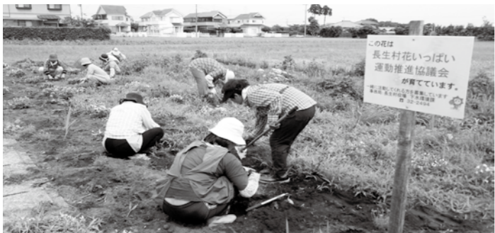
【花いっぱい運動の活動の様子】