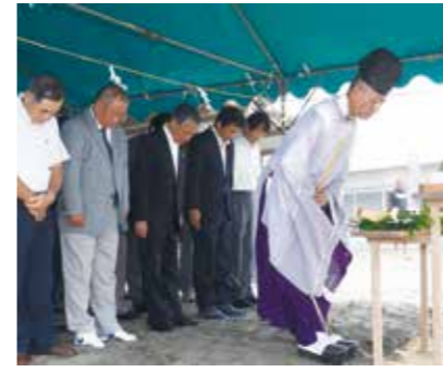
【海での無事故を祈願しました】

7月16日から一松海水浴場が海開きになりました。 初日は海開きの式典が行われ、集まった関係者たちにより、シーズン中の海の安全が祈願されました。