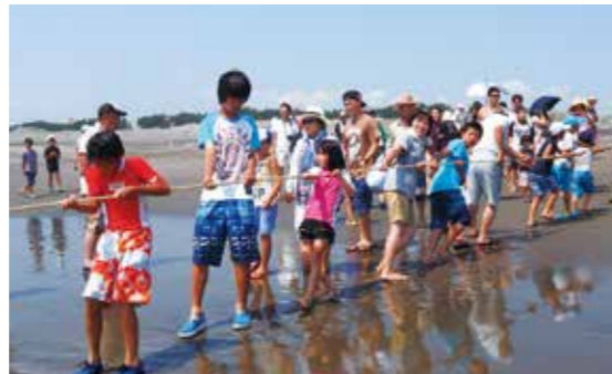
【みんなで力を合わせ網を上げました】

7月と8月の海水浴シーズン中に、毎年行われている長生村観光協会主催の「無料観光地曳網」が、今年も一松海岸で行われました。 天候などの都合で、今シーズンは7月31日の1回のみ開催となりましたが、晴天に恵まれ、多くの人たちが賑わいました。 参加者は、普段なかなか体験できない地曳網と、獲れたての生きた魚に直接触れる機会を楽しんでいました。