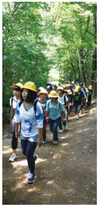
【紅葉台ハイキング】