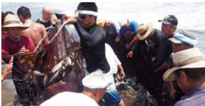
【網の中の魚に大歓声】

7月と8月の海水浴シーズン中に、毎年行われている長生村観光協会主催の「無料観光地曳網」が、今年も一松海岸で行われました。 天候などの都合で、今シーズンは7月31日の1回のみ開催となりましたが、晴天に恵まれ、多くの人たちが賑わいました。 参加者は、普段なかなか体験できない地曳網と、獲れたての生きた魚に直接触れる機会を楽しんでいました。