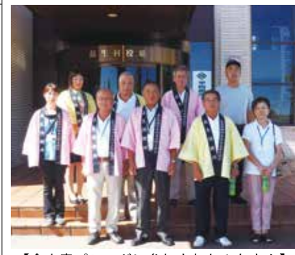
【食中毒パレードに参加されたみなさん】

8月6日、食中毒に対する注意を呼びかけるための、食中毒予防パレードが行われました。 パレードには、長生地区の食品衛生協会役員・食品衛生指導員・保健所職員のみならずが参加しており、食中毒に関する注意喚起を行いました。