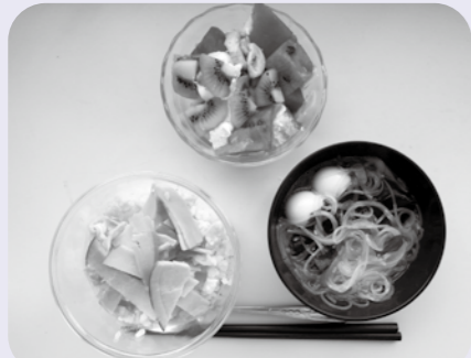
【チャレンジクッキングメニュー】

チャレンジクッキングは、学童保育に通う児童を対象としたクッキング教室です。今回作ったのは、カップちらしずし、はるさめとわかめのスープ、簡単トライフルの3品です。どれも大変おいしくできました。