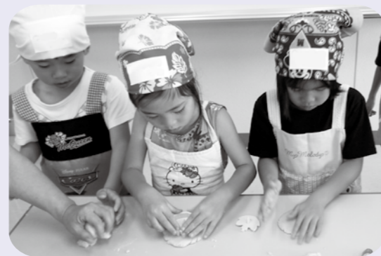
【クッキー作りに真剣】