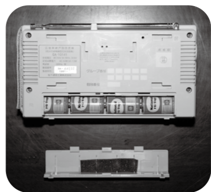
【防災行政無線個別受信機】

総務課では、個別受信機の新規設置、修理を受け付けています。新規設置負担金は、1万5千円です。