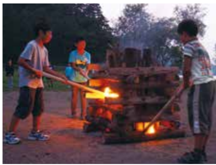
【キャンプファイヤー】

加し、夜は怖い話で盛り上げました。 また参加者は、ほうとう作り体験や紅葉台ハイキング、湖畔から観る花火大会などの体験を通して、自然の中で仲間とのきずなを深め、楽しい夏の思い出をつくることができました。