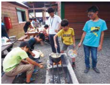
【ほうとう作り体験】

8月1日から3日まで、長生村青少年相談員連絡協議会主催によるキャンプ大会が、山梨県の西湖湖畔キャンプ場で、村内の小学校6年生62人、中学生ジュニアリーダー24人など総勢112人が参加しました。 1日目には、小高村長も参