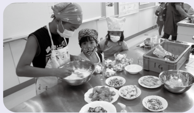
【みんなで協力して作りました】