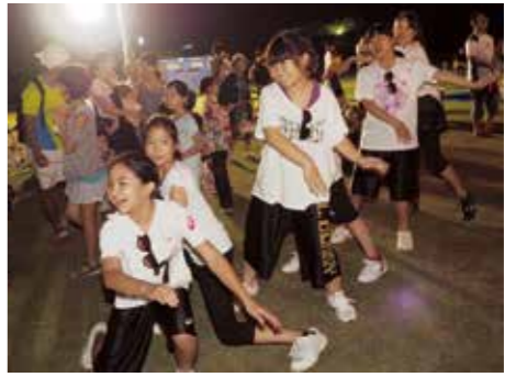
【オリジナルのダンスを披露】