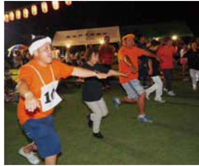
【長生音頭を踊りました】

また、17チームが参加しての踊りコンテストも行われ、長生音頭を基に、オリジナルのアレンジを加えた踊りを披露し、それぞれの演技を競いました。