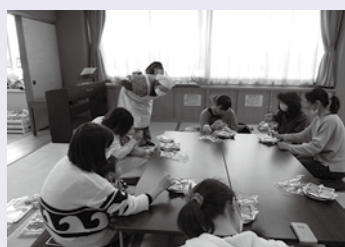
【作った離乳食を試食！！】

食べることにしても、赤ちゃんは成長と共にひとつひとつマスターしていき、やがて大人と同じものが食べられるようになっていきます。