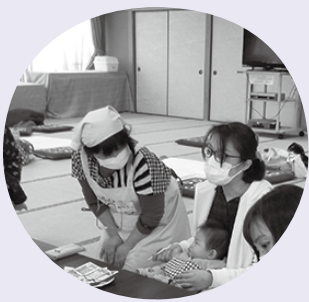
【おいしく食べられたかな？】

月齢5、6カ月頃の赤ちゃんは、初めての離乳食との出会いとなるため、ドロドロした状態の離乳食で飲み込むための練習をしていきます。月齢7、8カ月頃になると1日2回食となり、食べ物の形態もやや形をあらわしたものとなりモグモグの練習をしてくようになります。