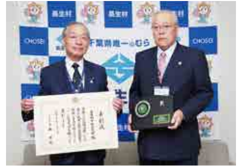
【賞状と盾を手にする村長と教育長】

これは、事業内容等に工夫をこらし、地域住民の学習に大きく貢献している公民館に送られるもので、3月8日に文部科学省で表彰式が行われました。