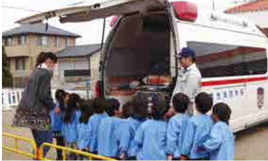
【救急車の中を見せてもらいました(高根保育所)】