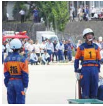
【第6支団第1分団第5部の演技】