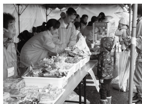
【前回のこども祭り】

わたしのゆめは、かんごしです。けが人やびょうきの人をたすけて、えがおにして家へかえした人からです。そしてこの長生村の人をたすけられるようなかんごしになります。