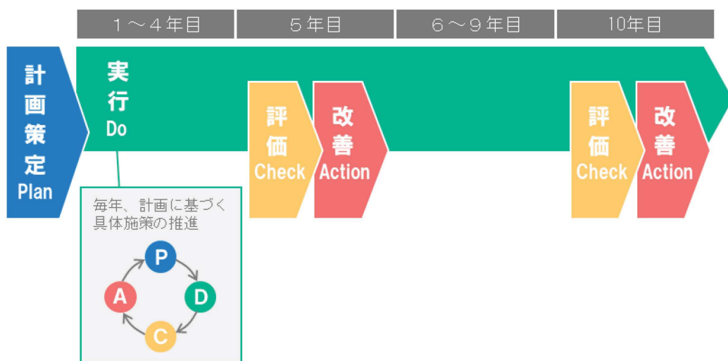
図 17 PDCAサイクルによる計画推進イメージ

なお、本計画は各町村の他計画の指針として位置付けているため、国土強靱化に関する他の計画については、各計画の見直しや改定等に合わせて必要な検討を行うことで、本計画との整合を図るものとする。