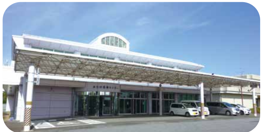
長生村保健センター