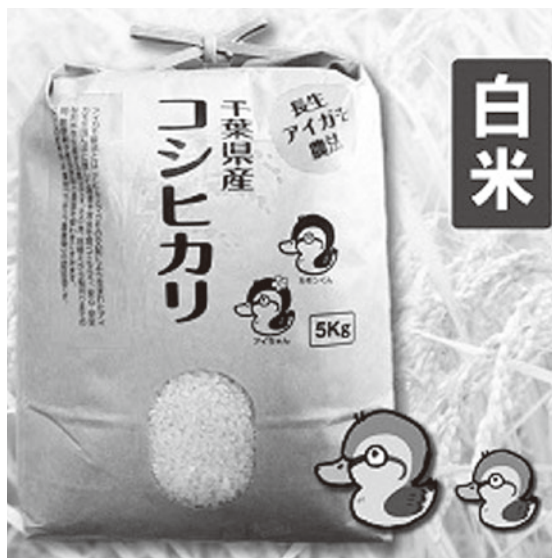
村の返礼品の一つであるアイガモ米