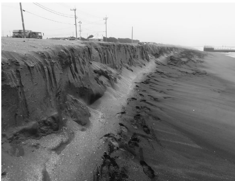
現在の一松海岸の状況

「一般住宅向け補助金制度」「公用車のドライブレコーダー設置状況」「長生中学校屋上の太陽光発電パネル設置計画について」の質問がありました。