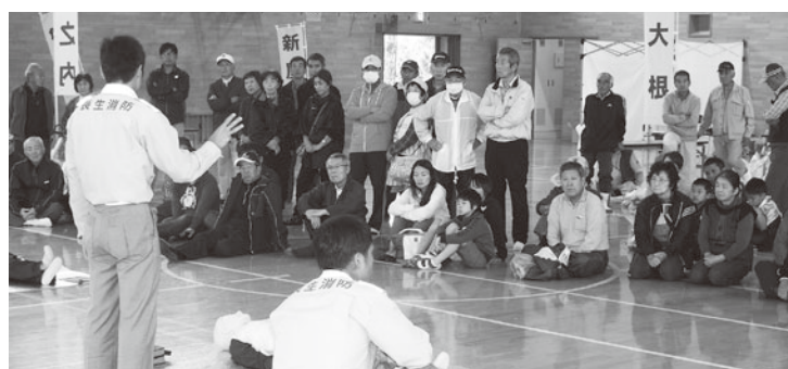
救命講習もおこなわれました（一松小学校）

整備された避難道路を利用し、内陸への避難および津波避難施設3ヶ所への避難経路の確認、防災備蓄品などの取り扱いや避難所機能の周知をはかりました。また、一松小学校体育館において、長生分署の消防職員の指導によるAEDの操作と救命講習を実施しました。