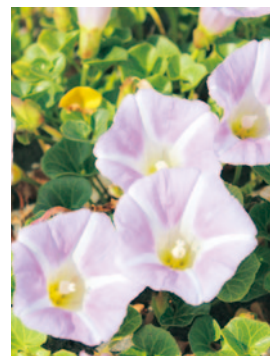
村の花「ハマヒルガオ」