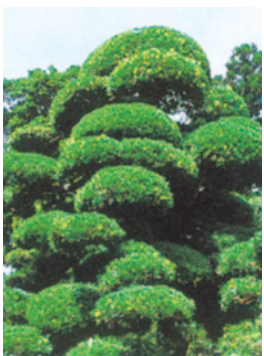
村の木「ラカンマキ」