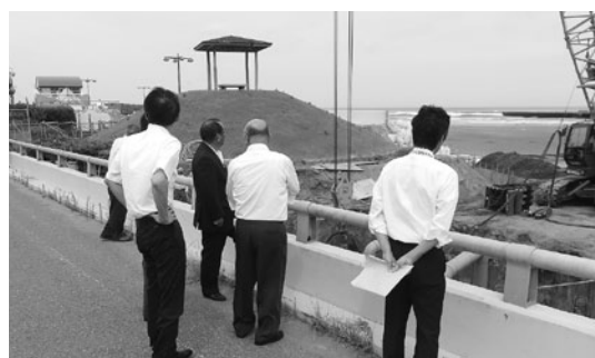
一宮川河口を視察

本年3月の議会報告会において、村の特産品のひとつである青のりの不作および一宮川河口の土砂堆積 たいせき についての質問がありました。 この調査研究をおこなうため、6月会議において総務経済常任委員会から所管事務調査の申し出があり、7月24日・10月16日に調査を実施しました。 ◎青のりの不作調査 勝浦水産事務所職員同席のもと、佐倉市の内水面水産研究所を訪問しました。