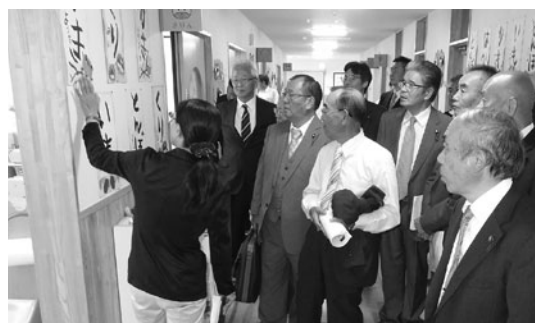
富山学園の施設内を見学（南房総市）

昨年4月に小中一貫教育が制度化され、地域の実情を踏まえた取り組みが進められているなかで、10月3日に富山学園の施設一体型一貫教育、4日に箱根町の施設分離型一貫教育を視察しました。 ◎南房総市立富山学園 教育委員会が保育も所管し、こども園や学童保育を併設した全国初の保幼小中一貫校を開校しました。経済基盤が脆弱な地域にあつて、南房総に残つても