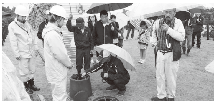
防災用品の使用方法を確認しました（竜宮台築山公園）

今年の訓練は、津波高10mを想定して実施しました。避難訓練を通じて、地域・家庭で定める避難経路、一次避難場所および二次避難場所を確認するとともに地域防災力向上を目的としました。