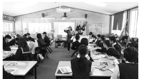
今年度のホームステイの交流会の様子

この協議会規約中には、「他国の生徒を受け入れる」としてありますので、今後検討します。