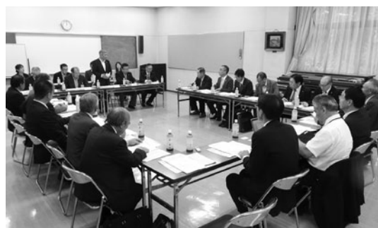
活発な質疑がおこなわれました（箱根町）

昨年4月に小中一貫教育が制度化され、地域の実情を踏まえた取り組みが進められているなかで、10月3日に富山学園の施設一体型一貫教育、4日に箱根町の施設分離型一貫教育を視察しました。 ◎南房総市立富山学園 教育委員会が保育も所管し、こども園や学童保育を併設した全国初の保幼小中一貫校を開校しました。経済基盤が脆弱な地域にあつて、南房総に残つても