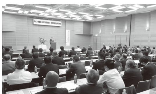
熱心に聞き入りました

らの判断・裁量で独自のルールや基準を決められるようにすることが必要なため、国の制度等を見直し、国の関与・規制を絞り込み、地方公共団体の条例制定権を拡大したと。また、国の制度改革に関する提案をおこない、実情に応じた地域課題の解決が可能になることについて、例題を挙げながら熱心に説いてくださり、大変有意義な研修をすることができました。