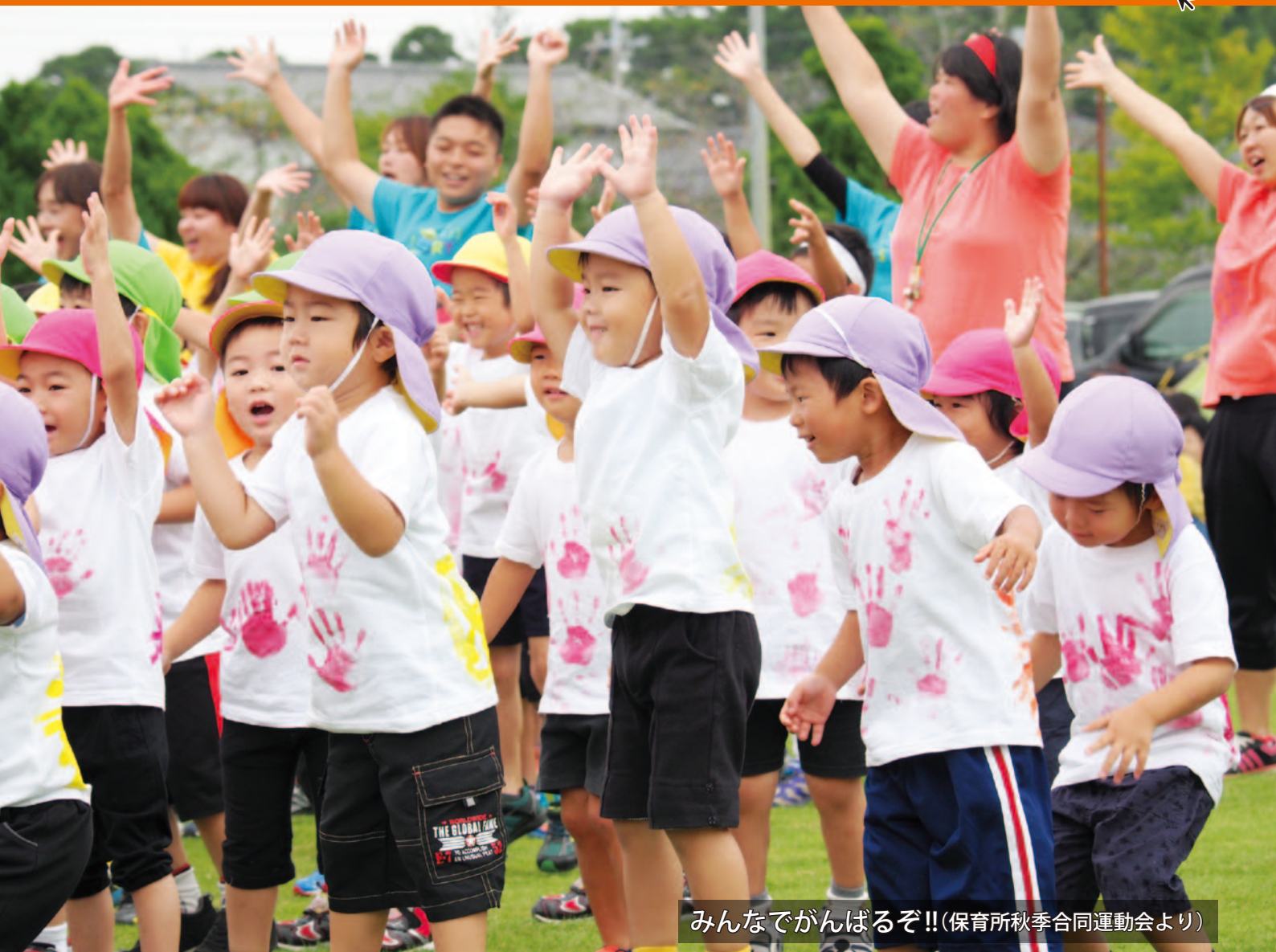
みんなでがんばるぞ!!(保育所秋季合同運動会より)