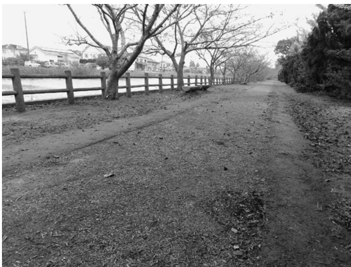
尼ヶ台総合公園内に整備されたウォーキングコース