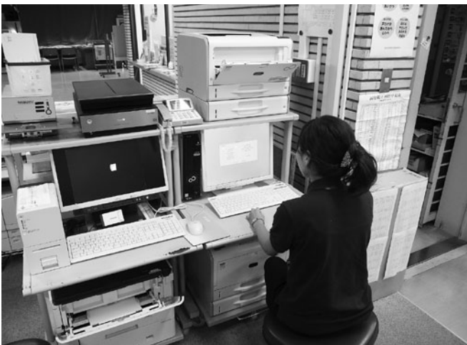
基幹業務システムのクラウド化を

※自治体クラウドとは 自治体が情報システムを庁外のデータセンターに保有・管理し、通信回線を経由して利用する形態です。