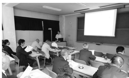
内水面水産研究所を訪問

本年3月の議会報告会において、村の特産品のひとつである青のりの不作および一宮川河口の土砂堆積 たいせき についての質問がありました。 この調査研究をおこなうため、6月会議において総務経済常任委員会から所管事務調査の申し出があり、7月24日・10月16日に調査を実施しました。 ◎青のりの不作調査 勝浦水産事務所職員同席のもと、佐倉市の内水面水産研究所を訪問しました。