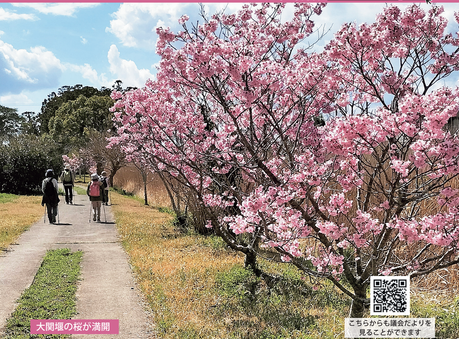
大関堰の桜が満開