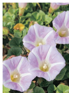
村の花「ハマヒルガオ」