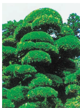
村の木「ラカンマキ」