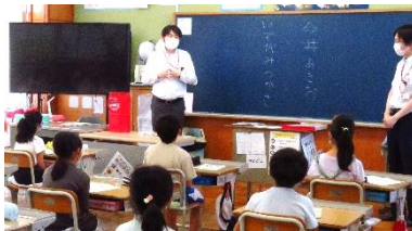
「手紙の旅」についても解説

本物の郵便はがきを活用し、手紙のやり取りを通じて心と心のコミュニケーションを育むきっかけになったと思います。