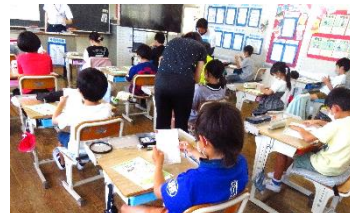
じっくり考えて丁寧に書く