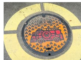
安全マップ作成のために記録しました。