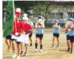
マーチングの練習