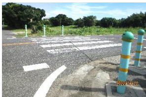
児童の目線での安全・危険個所を調べました。

9月22日(木)3年生が3グループに分かれて引率職員と共に村探検を行いました。①蟹道グループ、②城之内築山グループ、③昭和グループがそれぞれの安全・危険個所を調べ、メモや画像で記録してきました。今後、調べたことをもとに安全マップを作成し、コンクールに出品する計画です。