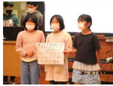
スローガンの発表（3年）