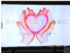
アンケート結果を発表