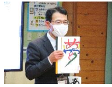
「ありがとう」の大切さ