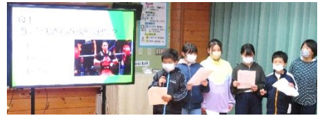
工夫を凝らしたあすチャレ報告会（5年）