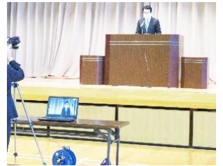
リモート映像を各教室へ

3学期は、学習面や生活面、全てにおいて1年間の復習をし、まとめを行う期間となります。そして、2月下旬には、千葉県標準学力検査を実施します。皆様の御協力と御支援をいただきながら、 安全と健康を第一に 、着実に学習を進め、 確かな学力と豊かな心 を育てていきたいと考えています。本年も、どうぞよろしくお願ひします。そして、この一年間が皆様にとって、穏やかで明るく、素晴らしい一年となりますことを、心より願っております。