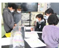
どちらに向かうか