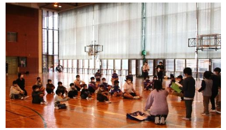
学習クイズに集中する児童・生徒

各学校の発表も、学習クイズやレクリエーションゲームなど、 工夫が凝らされ、楽しくとても盛り上がり ました。感染予防をしつつも、 顔を合わせての心の交流 が図れていました。小学生にとっては、スムーズな進学の助けになったと感じます。