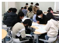
ハザードマップ活用

3学期に下校途中の津波想定避難訓練を計画しています。ハザードマップの記入等、御協力ありがとうございました。