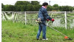
草刈り機の周りは注意して

また、PTA役員会では、子供たちがより安全に楽しく学校生活を送れるように建設的な意見交換ができました。 交通安全 や可能な PTA行事の充実 を推進して参ります。保護者の皆様の御支援御協力をお願いいたします。