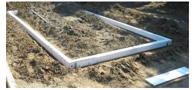
陸上の走り幅跳びでも活用。

遊具については、安全点検を計画的に行っていますが、児童が安全な環境の中で 体力や豊かな心 を育めるよう今後も整備して参ります。