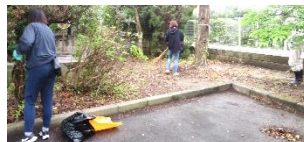
細かいところは手作業で