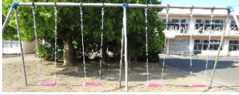
座面も新しくなり、快適で

村の予算により砂場を、PTA 会計からブランコを修理していただき、ありがとうございました。ブランコは3台が4台に増え、 座面も安定した座りやすい物 に替えました。砂場は、枠が劣化していた物を 安全な真新しい枠 に替えました。ブランコは休み時間の人気スポットとなり、砂場は、陸上部の走り幅跳びの選手に好評です。