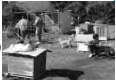
動物の世話も数が多いとちょっと大変