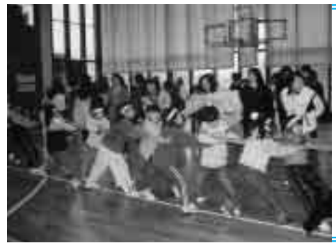
選手だけでなく応援団にも思わず力が