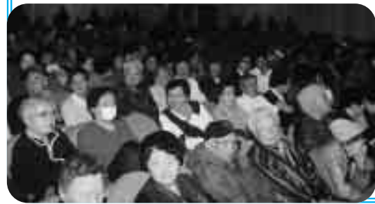
客席は最後まで超満員