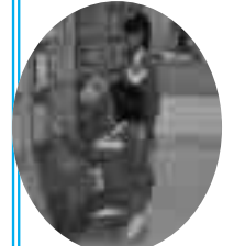
文化会館での図書整理