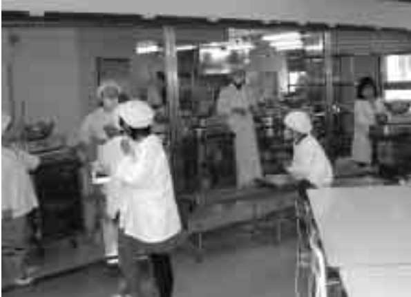
㊤ 自校方式で、作りたての温かい給食を配膳（八種小）