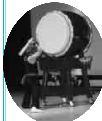
迫力ある大太鼓一人打ち（岩沼）