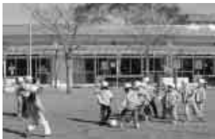
㊦ 園庭で元気に遊ぶ園児たち（一松保育所）