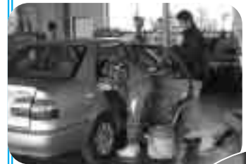
②入念に車の中の掃除をします