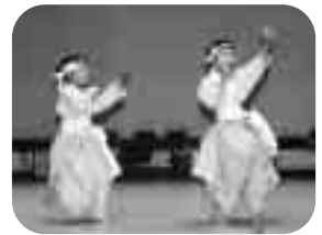
「白虎隊」を披露（竜巻町）姉妹でおどり