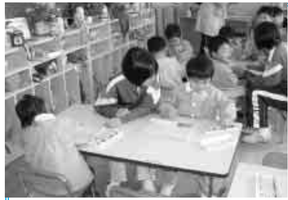
保育所で園児にお絵かきの指導

職種は様々で、保育所、病院、スーパーマーケット、ラーメン店、美容院など42の事業所で、生徒たちは実際の仕事を体験しました。「働く」ということを知識としてわかっていても、実際に行うのは初めてで戸惑う場面もあったようですが、教室では体験できない有意義な2日間を過ごしました。