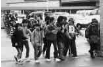
新しい長生村を発見してみませんか