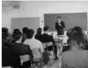
昨年の家庭教育学級の様子

現在の子育てにおける環境はとも好ましいとはいえません。児童虐待・いじめ・青少年による凶悪犯罪、不登校や自殺も年々増加しています。また性の氾濫により10代の妊娠・出産・中絶も増え、自分たちの世代では考えられたことのないような問題に苦慮している親も増えていきます。そこで本講座では、特に親子のふれあいを胎児から知るような、自然な形で性の教育や命の大切さについて扱います。よい子育て環境についての指針となりますので、ぜひご参加