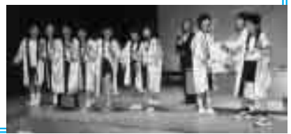
「心に残ったで賞」を受賞した高根小よさこいソーランのみなさん