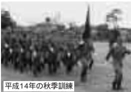
平成14年の秋季訓練

この時期は空気が非常に乾燥するため火災が発生しやすく、季節風の影響で大火につながることもあります。村内でも毎年必ず数件の枯草火災が発生しています。枯草火災から近隣の建物へ燃え移ることもあり大変危険です。雑草などが繁茂している土地を所有している人は、早めに草刈りを行ってください。