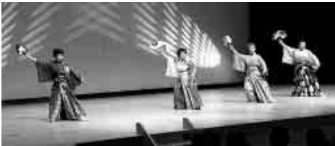
南部自治会による「白雲の城」