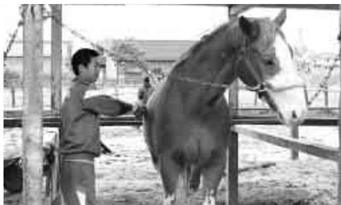
乗馬センタ - で馬のブラッシング

生徒はみんな自分の仕事を一生懸命頑張ってやっていたのでこの2日間のことを生活に生かしてほしいです。