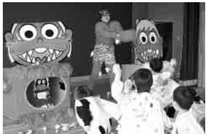
保育士扮する鬼が大活躍(?)しました