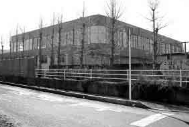
新しい長生中学校体育館