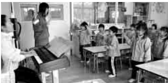
園児といっしょに歌をうたいました