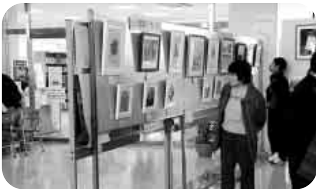
公民館教室の展示に見入ります