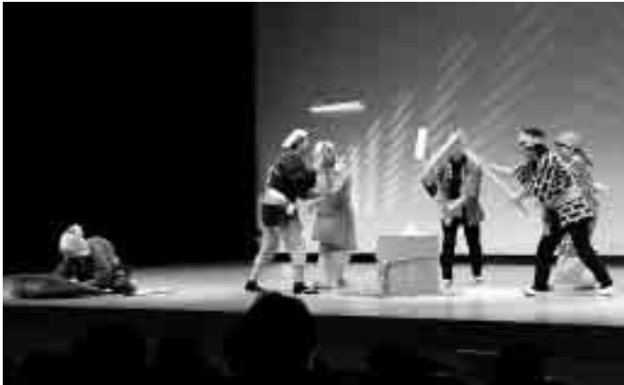
金田自治会による「南部もちつき唄」