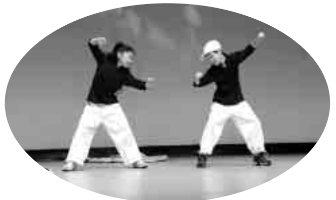
見事なダンスを披露した児童（高塚自治会）

発表終了後はお楽しみ抽選会も行われ、1等賞品DVDプレイヤー・などが用意され、みなさん最後まで楽しく過ごしました。