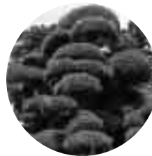
村の木：ラカンマキ 昭和45年11月3日指定