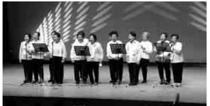
鷲自治会によるカラオケ