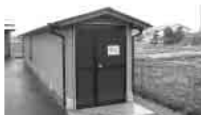
写真上のぼり竿 写真下収納庫