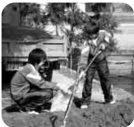
力をあわせて土のう作り