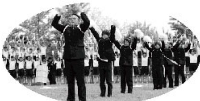
気合いのこもった応援合戦 (長生中)

中学では前日から天候が心配されていましたが、当日は好天に恵まれ、競技に、応援にと熱戦が繰り広げられました。高根小では鼓笛パレードや地区対抗リレーなど大変な盛り上がりを見せられました。