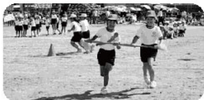
2人で息をあわせて (高根小)