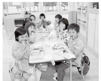
⑤給食でも食べられています