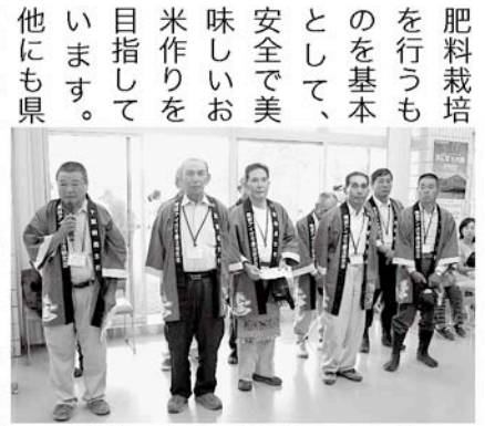
南部アイガモ農法研究会会員

村内には営農組合やオペレーター組合などの組織を立ち上げ、効率的に農業をすすめる人が増えています。これは、肥料栽培を行うものを基本として、安全で美味しいお米作りを目指しています。他にも県内ではエコ米と呼ばれる低農薬で作られているお米があります。県では、稲作の収穫時期を分散し、農作業を効率化するための優良な品種のお米を研究し、そこで生まれたのが水稲「ちば28号」(愛称ふさこがね)です。低温、暑さ、病気に強く、倒れにくく、粒が大きく食味のよいお米です。