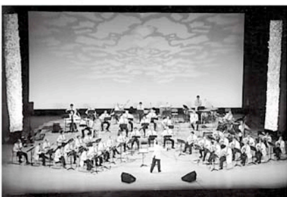
明治大学マンドリンOB倶楽部