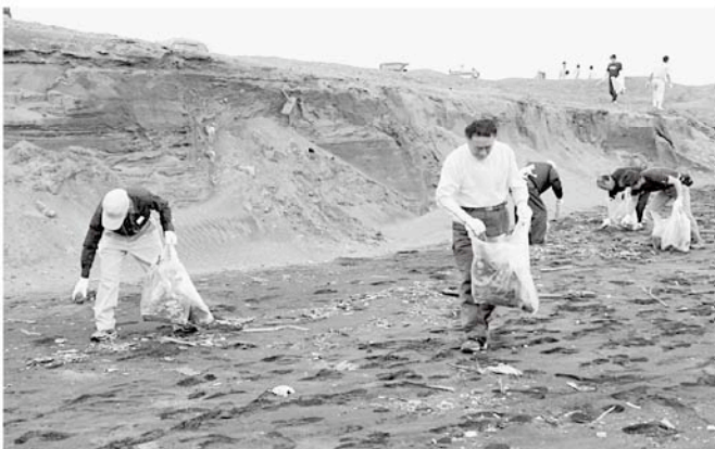
みんなで協力してごみ拾い