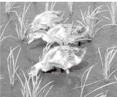
③雑草や害虫を食べるアイガモ