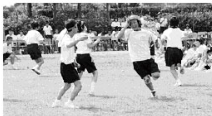
必死に逃げます (長生中)