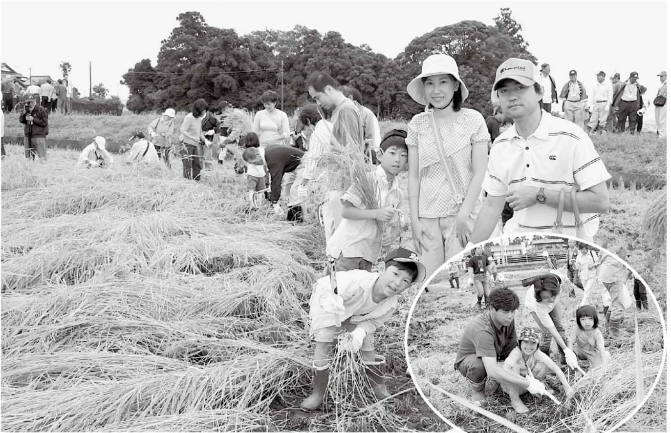
稲刈りって楽しいね！（アイガモ収穫祭）