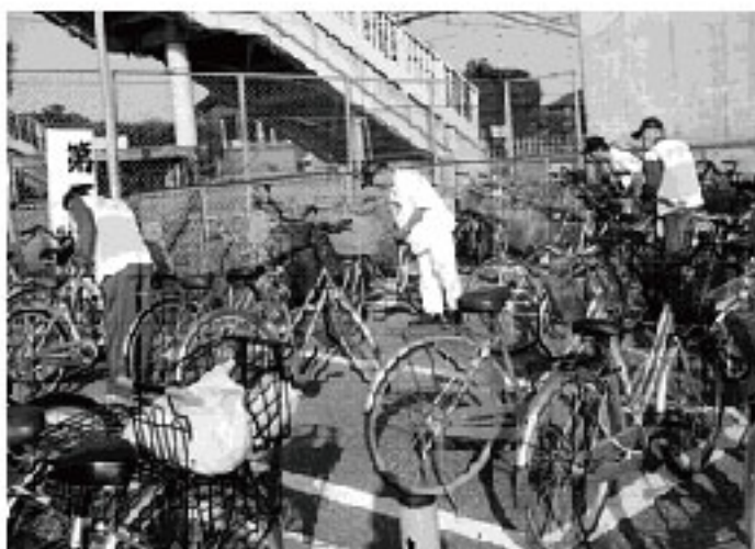
1台づつ確認していきます

駅のまわりに駐輪してあった自転車の3割位がステッカーがはがされていたり、ナンバーが見えなくなっていました。防犯登録ステッカーは自転車を購入したお店で貼ってくれます（有料）のでご確認ください。