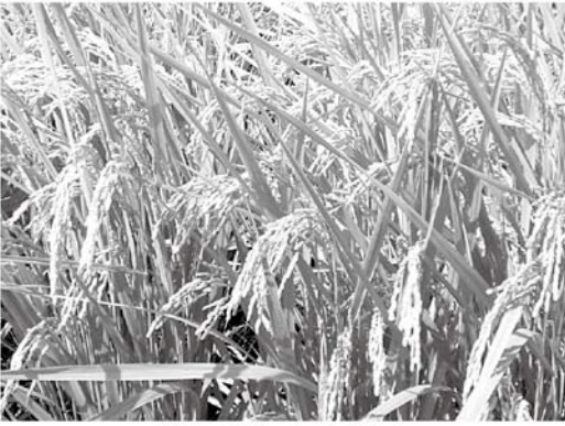
実りの秋となりました

炊きたてのご飯、おにぎりやお茶漬けにお粥 かゆ など何気なくお米を食べている人が多いと思いますが、お米がどのように作られているのか一度考えてみませんか？