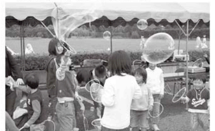
昨年の子ども祭り