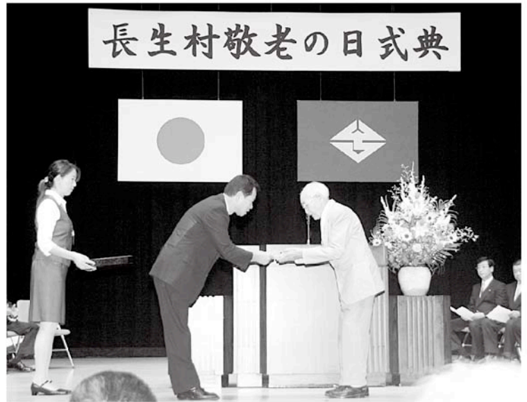
代表者に記念品が渡されます