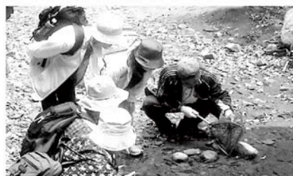
春の自然観察会から