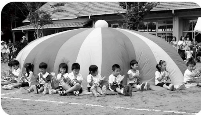
今年も大成功 バルーン（八積保育所）