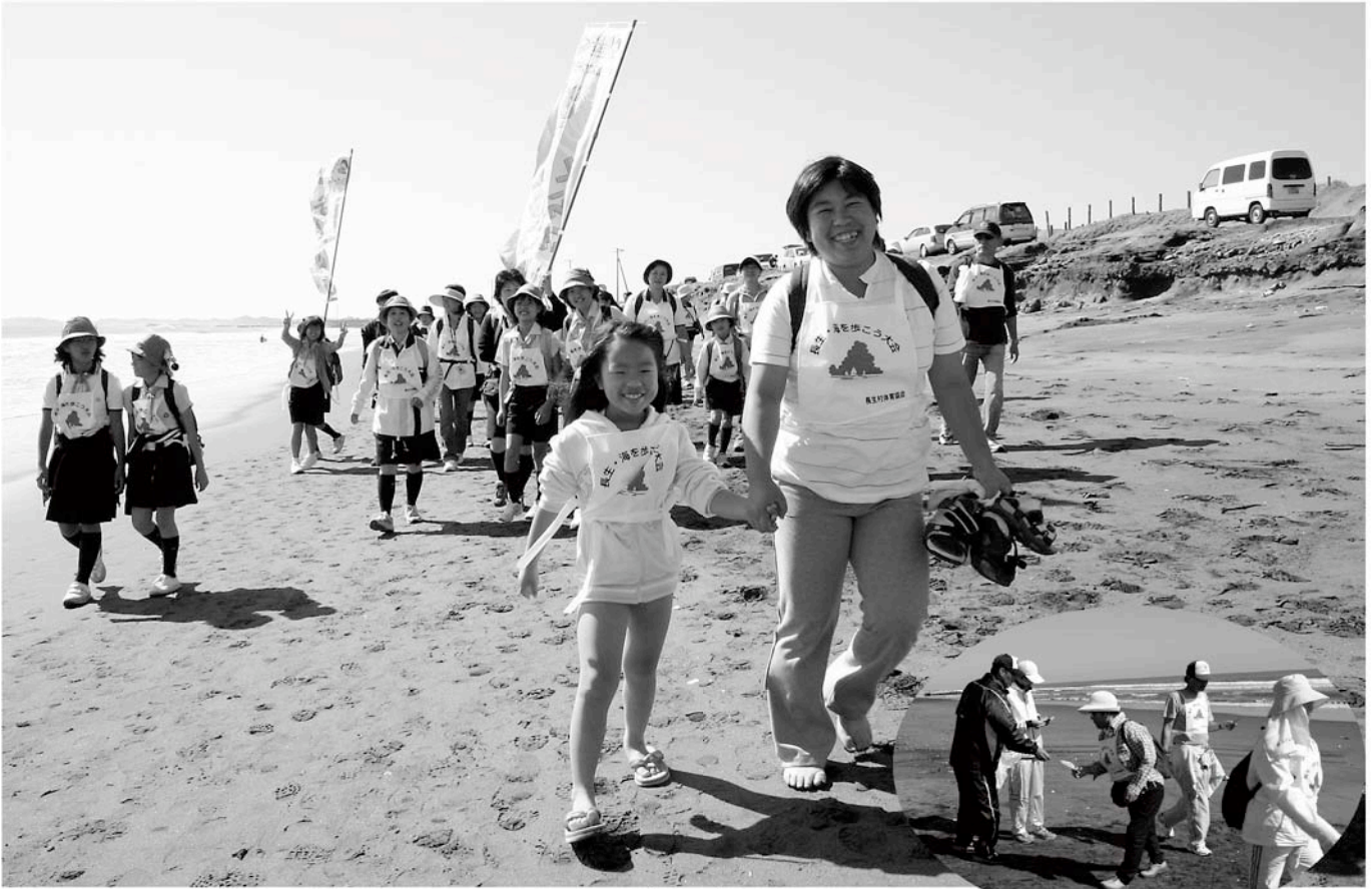
みんなで楽しく歩きました