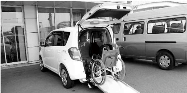
新しく購入された福祉カー