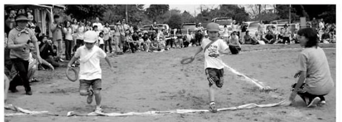
同時にゴール！（八積保育所）