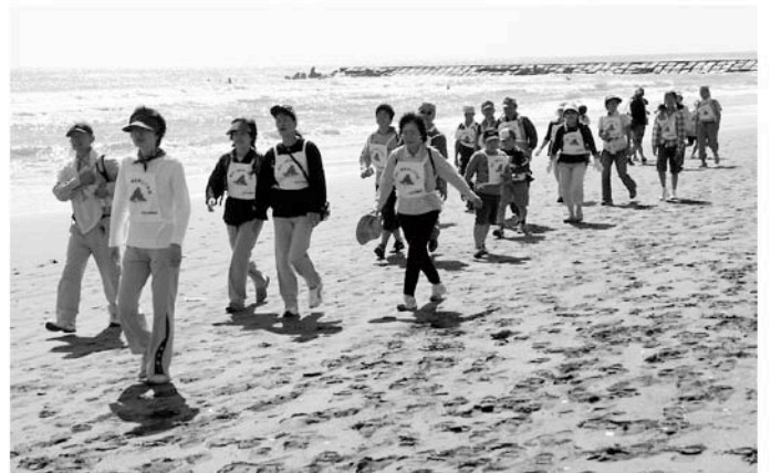
海辺をウォーキング

参加者からは「もっと距離があっても平気」「海沿いを歩いて気持ち良かった」などの声。主催者の中川体育協会会長からは「村おこしの一環ではじめてが予想より参加者が多く、みなさんが喜んでくれ大成功。来年はもっと規模を大きくしたい」と、力強いコメントを頂きました。