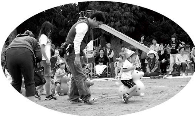
保護者もいっしょに（高根保育所）