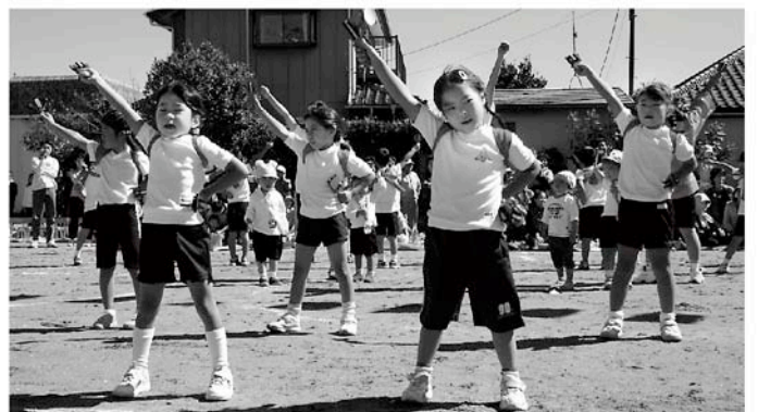
きまった！（一松保育所）