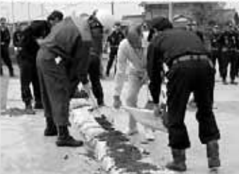
力を合わせて土のう積み

どです。 災害時の対応方法を住民のみならず、皆さんに知ってもらうと同時に、いざというときに近所同士が力をあわせて助け合えるような体制を作っていきたいですね。