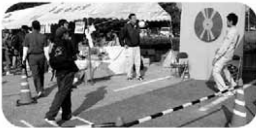
何が当たるかな？ (産業まつりゲームコーナー)

「第39回長生むら文化祭」と「第20回産業まつり」が11月3日に文化会館と中央公民館、旧役場跡地で開催されました。文化会館ホールでは公民館クラブ員によるダンスの発表などが行われ、会場は熱気に溢れていました。産業まつりでは恒例となったかかしコンテストが実施。23点が出展され、表彰式も行われました。ゲームコーナーも大盛況、午前中にほとんどの景品が無くなってしまいました。