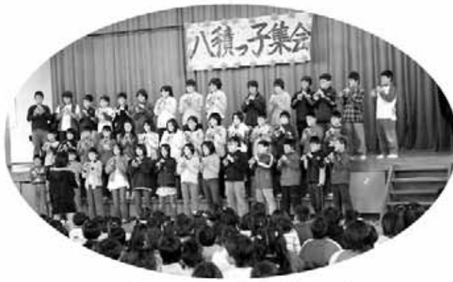
6年生による演奏会（八積小学校）