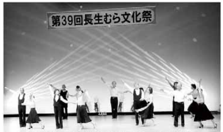
カトレア・ダンスクラブ (文化祭ホール発表の部)