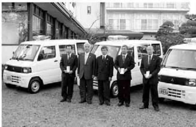
パトロールカーと首長、ライオンズ役員