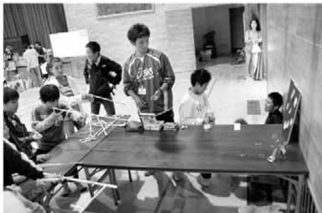
的をめがけて狙いを定めて（一松小学校）

各学校ともバザーや模擬店、ゲームコーナーなどが開かれ、八積小では体育館で児童による演奏などが披露されました。