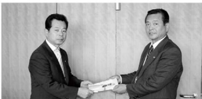
目録を受け取る村長