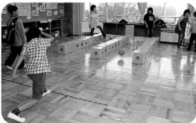
何本倒せるかな？（高根小学校）