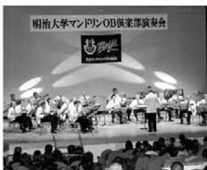
マンドリンの音色に聞き入りました