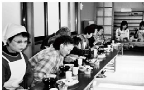
中瀬老人クラブとの食事