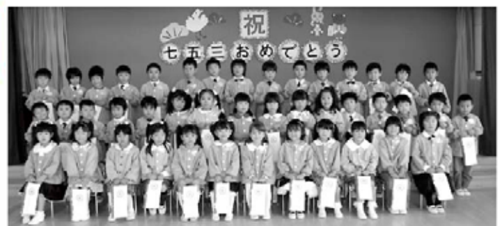
記念撮影も行いました (高根保育所)

寸劇が行われ園児は大喜び、高根保育所では年中、年少から歌のプレゼントなどが行われました。