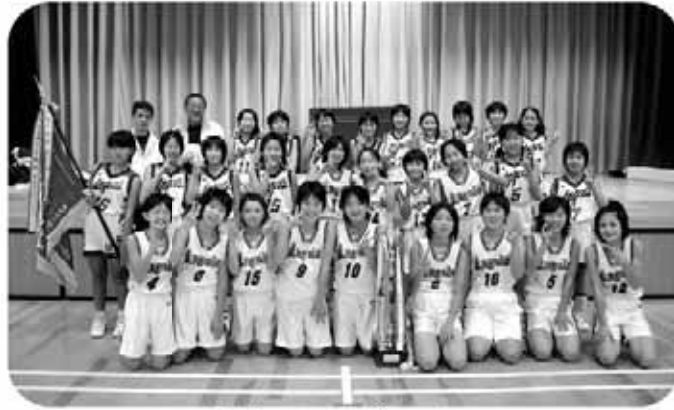
長生エンジェルス