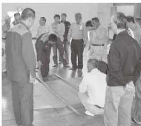
竹ざおと毛布を使っでの担架づくりの実演

どです。 災害時の対応方法を住民のみならず、皆さんに知ってもらうと同時に、いざというときに近所同士が力をあわせて助け合えるような体制を作っていきたいですね。