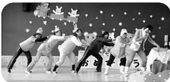
保育士による寸劇