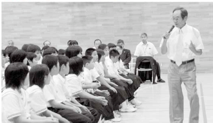
薬物乱用の恐ろしさが説明されました