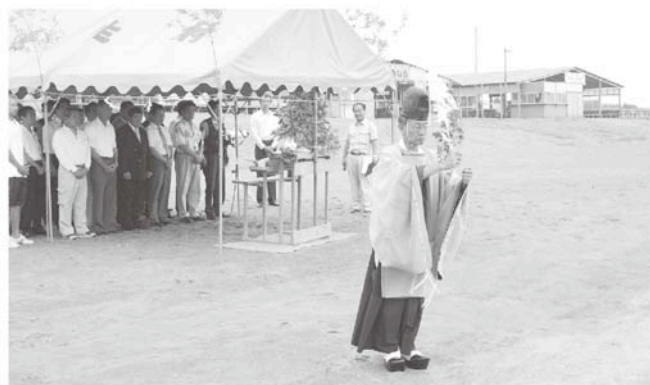
今シーズン事故のないようにと

今年の海水浴場開設期間は8月19日（日）までですので、ぜひ、海へお出掛けいただき潮風を満喫してみてくださいはいかがでしょうか。