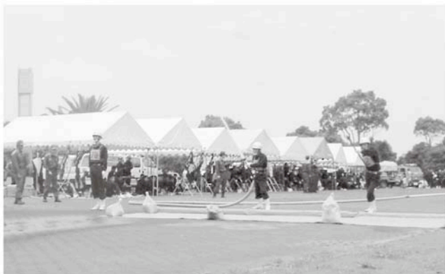
第1分団第5部（信友）による演技