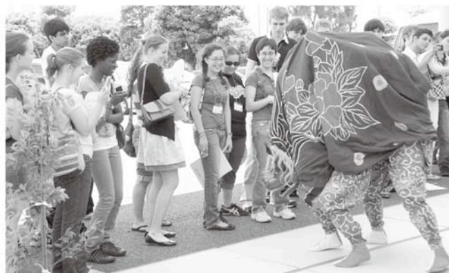
間近で見る獅子舞にびっくり

その後、更正保護女性会指導のもと、色鮮やかで、おいしそうな巻き寿司を作ったりと、楽しく郷土の文化に触れていました。