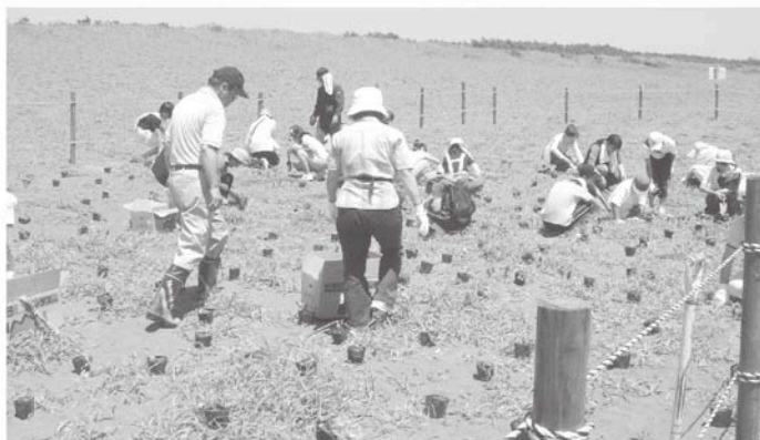
みんなで丁寧に植えました