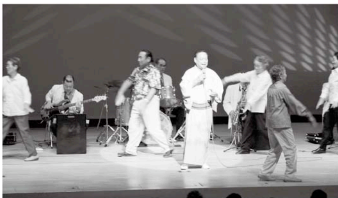
歌手の歌声に合わせて