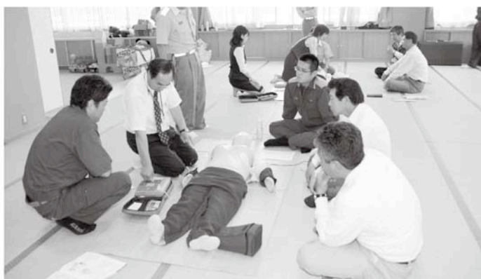
手順を確認しながら慎重に行いました

心臓マッサージなど実際にやってみると、思っていたよりも大変だったようで、汗をかきながら行っている職員もいました。