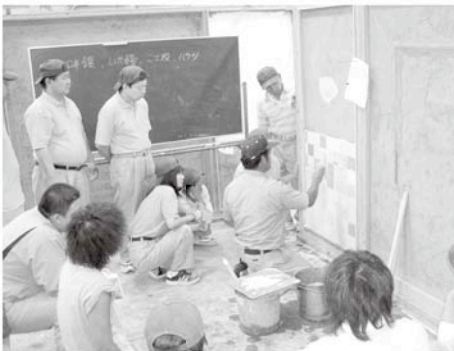
左官技術科の実習風景