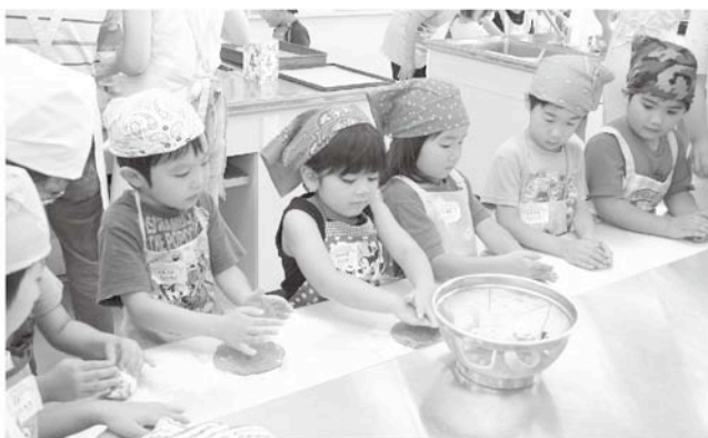
生地を平らに伸ばします