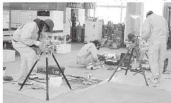
住宅設備機器科の実習風景