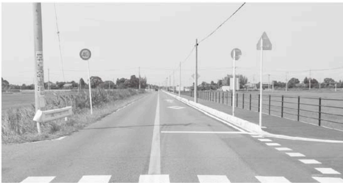
改修され歩道のついた道路