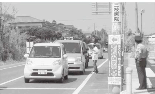
去年の8月に実施されたおしぼり作戦