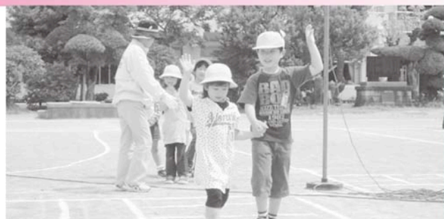
横断するときは手を上げて！

4月上旬から6月中旬にかけて、ボランティアの長生村交通安全対策協議会、交通安全推進隊、保護者のみなさんと茂原警察署の協力により交通安全教室を開催しています。長生村は交通事故の発生件数が非常に多く、昨年は郡内ワースト1位でした。新入生の通学も自転車運転初心者も慣れ始めた頃が危険、油断は禁物です！