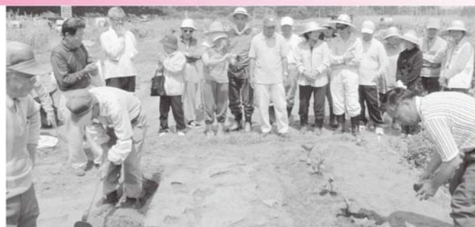
組合員によるわかりやすい実演

開園式には利用者約90名が参加し、長生村西栄貸し農園管理運営組合のみなさんによる、ナス・ピーマン・サツマイモの定植実演が行われました。手馴れた作業に、参加者のみなさん感心しながら熱心に見ていました。大切に育てた野菜を収穫する日が楽しみです。