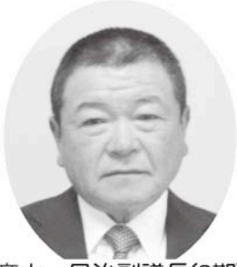
高山 昌治副議長(3期)