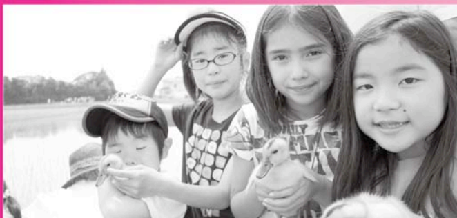
アイガモちゃん、がんばってお米を守ってね！

5年目となる南部アイガモ農法研究会主催のアイガモオーナーズクラブ放鳥式にアイガモオーナー277名が参加しました。オーナー達が生後約1カ月のアイガモを田に放すとアイガモは元気よく田の中を泳ぎまわっていました。また、放鳥後にはアイガモ栽培米の試食会や農産物の直売などが行われ、オーナー達はみんな満足した様子でした。