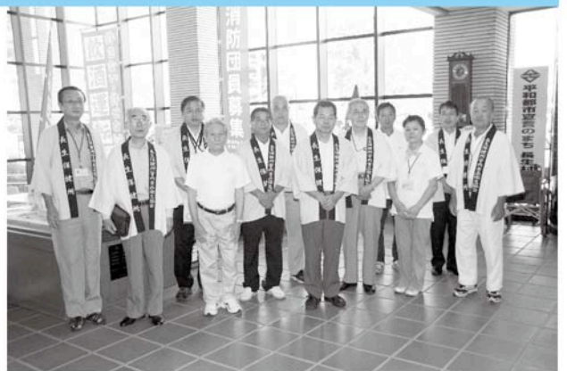
皆さん、食中毒にはご注意ください

このパレードは、長生地区の食品衛生協会役員・食品衛生指導員・保健所の職員の皆さんが、食生活の安心と安全を守るために、毎年、食中毒多発期を前に実施しています。