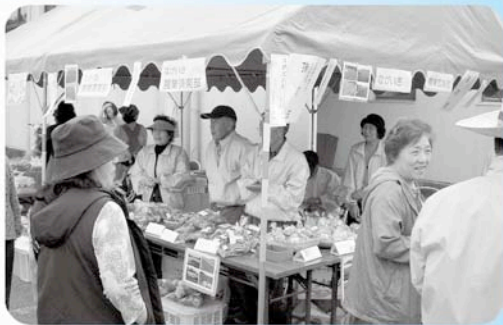
(一昨年の出店の様子)