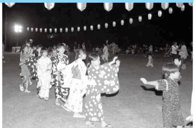
夕闇にきれいな浴衣姿が映えますね

8月7・8日と長生村盆踊り大会実行委員会主催による、長生村盆踊り大会が盛大に開催されました。今年は会場を、尼ヶ台総合公園に移し、皆さんご存知の長生音頭などを踊りました。また大会イベントとして、2日間とも先着500名に景品が当たる抽選番号付うちわが配布され、くじ引き大会も行われました。