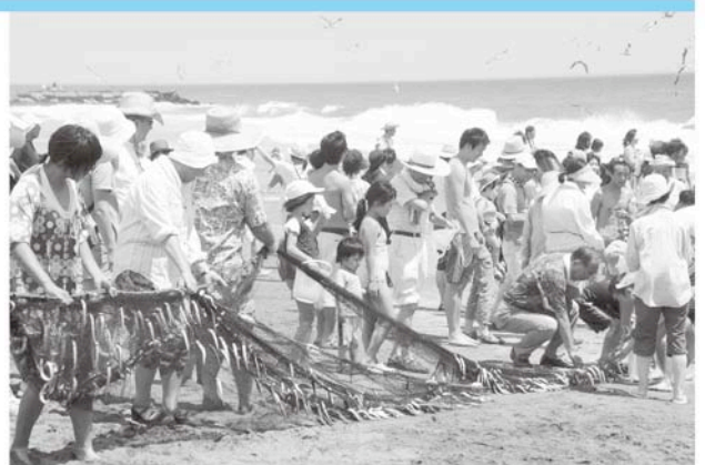
最後まで力を合わせて！

8月6日、無料観光地曳網に大勢のお客様がお越しになりました。今回はどんな魚が獲れるか期待に胸を膨らませ、大人から子どもまで力を合わせ一生懸命に網を引きます。今回の海の幸は、イワシでした。網にかかったイワシを皆さん夢中で取っていました。新鮮なお土産を手し、今年の無料観光地曳網は無事終了しました。