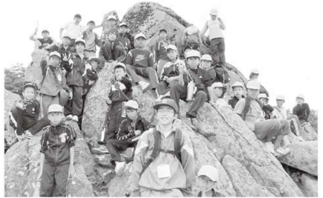
ハイキング中の猫石で、はいチーズ！

参加者は、飯ごう炊飯やハイキング、そしてテント宿泊といった自然に触れ合う体験をし、楽しい夏の思い出ができました。