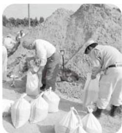
土建組合の皆さん ありがとうございました