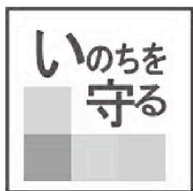
「自殺予防週間」 ロゴマーク

ストレスがある時は、自然や動物と触れ合ったり、植物を育てたり旅行に出かけたり、ひとりで自分を静かに見つめる時間を作ったりリラックスしましょう。