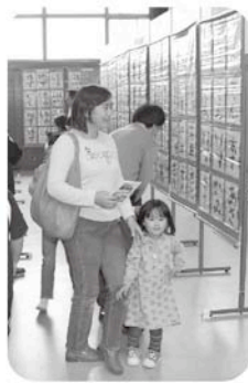
一昨年の展示の部