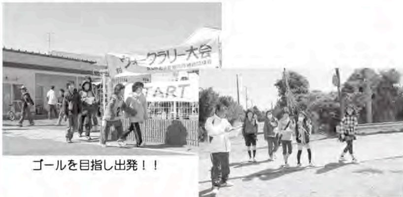
ゴールを目指し出発！！

青少年相談員手作りの順路を示す『コマ図』に従って、家族や仲間力を合わせ、3つのチェックポイントを通過しながら全チーム無事にゴールできました。