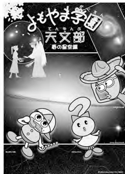
「よもやま学園天文部 春の星空編」