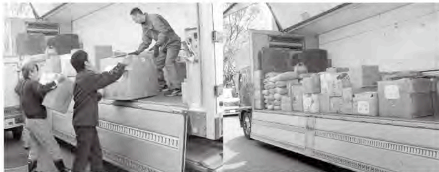
皆様よりご協力いただきました救援物資は4月21日役場から岩手県へと搬送されました