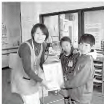
僕達、私達も義援金に協力しました