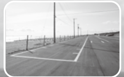
駐車場が舗装され、さらに快適に!