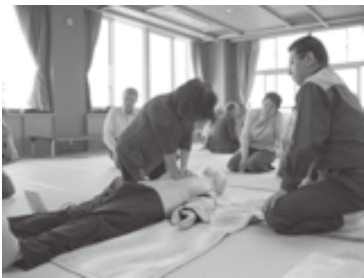
救命救急講習を受けている様子