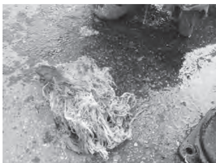
下水道管に詰まっていたモップ

ティッシュペーパー、生理用品、浣腸容器、雑巾、新聞紙やチラシなどの紙類、靴下、モップ、下着など。