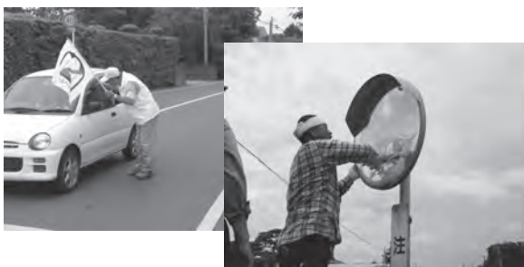
交通安全対策協議会による交通安全活動

整理や交差点における街頭啓 発活動等、年間を通して村民 の皆さんや道路利用者への交 通安全活動を実施しています。 活動に参加できる人は建設 課までお気軽にご相談ください。