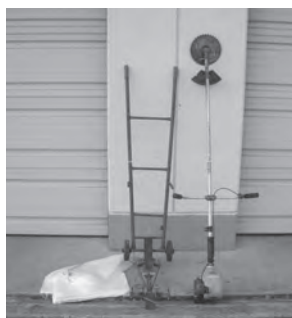
貸出用草刈機、側溝蓋上げ機

清掃で出た土砂などの回収 を希望される場合は、土の う袋に入れ、まとめて置い てください。連絡いただけれ ば、回収に伺います。