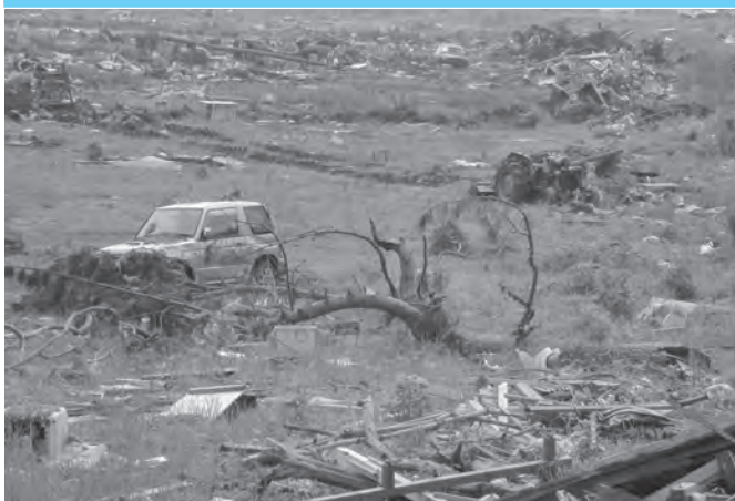
七ヶ浜町の被災状況