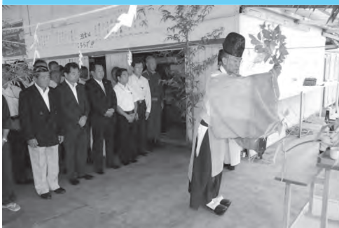
厳粛な雰囲気の中、安全祈願が行われました。