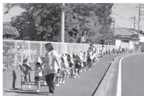
高根保育所から高根小学校への避難の様子

津波発生時に危険を回避するため一時的に避難する施設で、避難所とは異なるため災害が落ち着いた段階で避難所に移動していただきます。