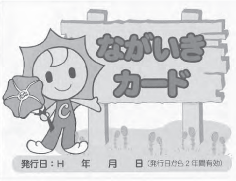
生まれ変わった「ながいきカード」