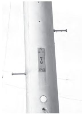
東京電力の電柱番号

なお、外灯の球切れや故障、カーブミラーの修理は、ごなたからでも受けつけていますので、お気づきの箇所がありましたら、ご連絡ください。外灯の球切れのご連絡の際には、東京電力の電柱に設置してある電柱番号とおおよその場所をお伝えいただけますと迅速に対応できます。