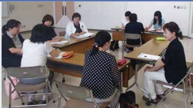
【保育所と学校職員の合同会議】

長生村教育委員会では、平成25年度から小中連携に取り組んできましたが、29年度から「保小中一貫教育」に取り組んでいきます。村の宝である子どもたちが、生まれてから義務教育の課程を修了し、進路を決定するまでの15年間を、4つの目標を持って支えます。