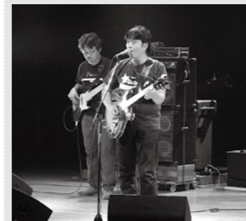
【昨年のフェスティバル】

アマチュアバンドによるコンサートを行います。オリジナル曲からコピー曲もありです。みなさん、生の音楽を聴きにきてください。 とき 10月8日(土) 開場 午後3時 開演 午後3時30分 料金 入場無料 主催 長生村バンドフェスティバル実行委員会 共催 長生村教育委員会 問い合わせ 生涯学習課(文化会館) ☎(32)5100