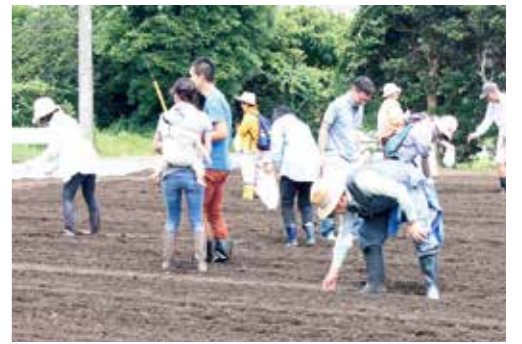
【10月が待ち遠しいです】