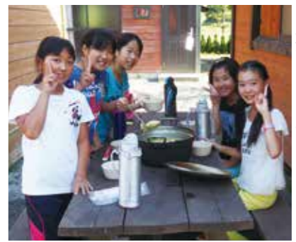
【みんなでそろって食事】

参加者は、ほうとう作り体験や紅葉台ハイキング、キャンプファイヤーなど、自然の中で仲間とのきずなを深め、