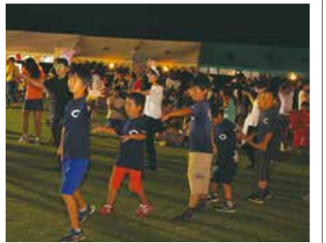
【小学生チームも参加】