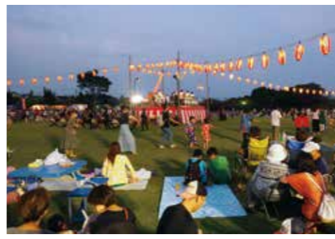
【お客さんで賑わう会場】

その後、踊りコンテストが行われ、11チームが参加。長生音頭に、それぞれオリジナルのアレンジを加えた踊りを披露しました。