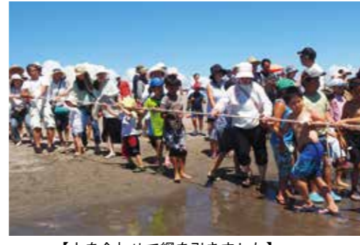
【力を合わせて網を引きました】

7月と8月の海水浴シーズに合わせて、一松海岸では長生村観光協会主催による「無料観光地曳網」が行われました。