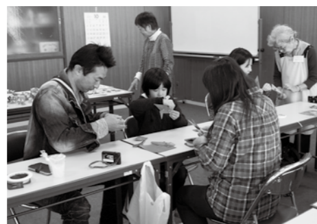
【昨年の子どもの祭りの様子】

今年も、第12回ちょうせい子ども祭りを10月30日(日)の午前10時から中央公民館、文化会館にて開催します。 「来て 見て 体験して 楽しいことがいっぱいあるよ!」をテーマに、子どもたちが安全に、そして楽しい一日が過ごせるよう、お手伝いいただけるポランティアを募集します。ぜひ、文化会館までご連絡ください。 主催 ちょうせい子ども祭り実行委員会