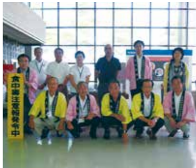
【パレードに参加したみなさん】

8月4日、食中毒に対する注意を呼びかけるための、食中毒予防パレードが行われ、食中毒に関する注意喚起が行われました。