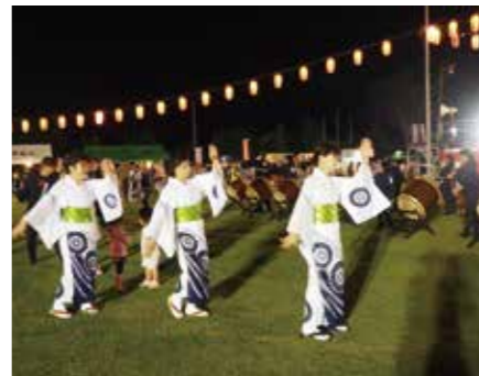
【曲に合わせて踊ります】