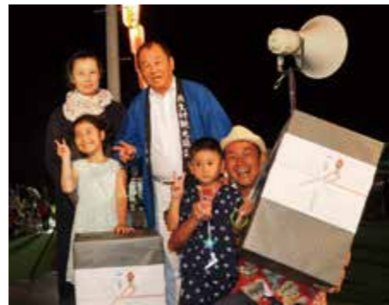
【抽選会で1等が当たりました】