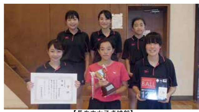
【長生中女子卓球部】

8月21日、村体育館で、長生村体育協会主催の中学生卓球大会が開催され、長生郡内の5校の中学生が参加し、熱戦がくりひろげられました。長生中学校は、男女とも団体戦優勝、個人戦男子が優勝するなど素晴らしい成績を残しました。