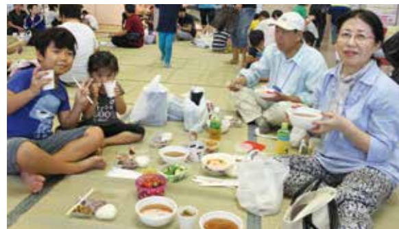
【みんなそろって食事】