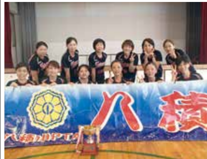
【優勝した八積小チーム】

9月4日、第17回長生村PTAバレーボール大会が長生村体育館で開催されました。家族たちが応援する中、優勝を目指し、熱い戦いが繰り広げられ、八積小PTAが優勝しました。 結果は次のとおりです。 優勝 八積小PTA 準優勝 長生中PTA