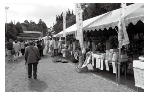
【農産物の直売が行われます】