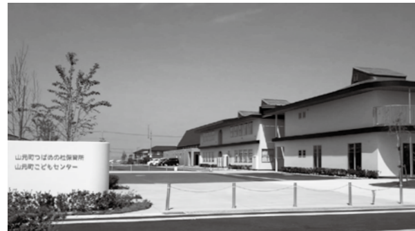
【つばめの杜地区のこどもセンター】

進んでいる3地区の新市街地「新山下駅周辺地区・新坂元駅周辺地区・宮城病院周辺地区」のうち、「つばめの杜地区（旧新山下駅周辺地区）」、並びに「新坂元駅周辺地区」についてですが、市街地造成