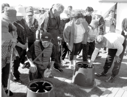
【避難施設の道具を確認(昨年の防災訓練より)】

一次避難訓練では、自身の安全確保と、各地区の集合場所や安全な避難場所への避難、二次避難訓練では、