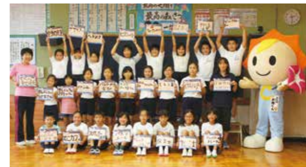
【太陽くんと一緒に記念撮影】

9月14日、一松小学校でこども宇宙プロジェクトの写真撮影が行われました。この企画は、国際総合企画株式会社主催によるもので、児童は将来の夢を書いたボードを手に、満面の笑みで撮影をしていました。写真はデータ化され、来年春ごろ、約1カ月宇宙旅行をします。その後打ち上げ証明書と一緒に旅をした花の種子が贈呈されます。撮影に太陽くんもかけつけ大人気。