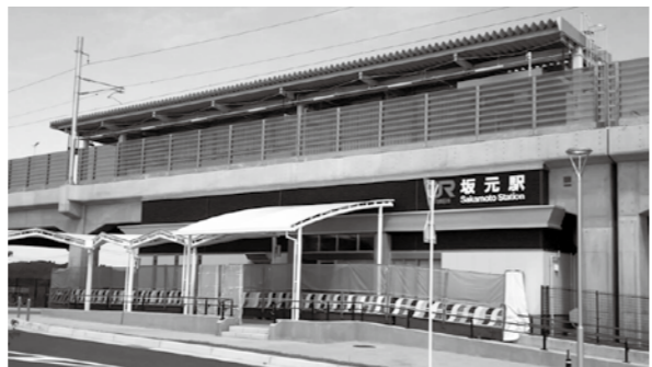
【駅舎の完成した坂元駅】

次に、平成26年5月に着手されたJR常磐線の復旧事業の進捗ですが、山下・坂元両駅ともに、駅舎やホームの工事もすでに完成しており、架線や信号等の電気工事の間もなく完了する見込みです。 7月28日には、JR東日本から発表があり、常磐線浜吉田駅から相馬駅までの区間については、今年12月10日に、運転が再開となることとです。震災以降、町の悲願であった常磐線の運転再開までの道筋がはっきりと示され、町民生活や経済面への効果が大きいに期待されています。 復興・創生関連事業は、約155億円で予算全体の72・8%を占めており、この他にも、山元南スマートインターチェンジの建設や津波襲来時の一時避難場所として、3カ所（牛橋・花釜・笠野）で整備を進めている防災公園整備事業、農業基盤整備事業、企業誘致事業など、様々な事業が進められています。 東北でも有数のいちご産地である山元町の特産品は、今年3月に「ふるさと名品オブ