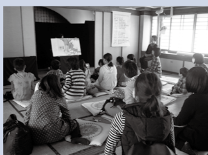
【去年の子ども祭りの様子】