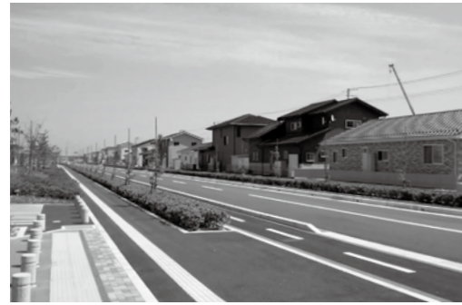
【工事の完成したつばめの杜地区】

進んでいる3地区の新市街地「新山下駅周辺地区・新坂元駅周辺地区・宮城病院周辺地区」のうち、「つばめの杜地区（旧新山下駅周辺地区）」、並びに「新坂元駅周辺地区」についてですが、市街地造成