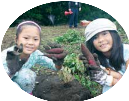
【さつまいもを収穫】

族との会話を楽しんでいる様子でした。 昼食後はお土産として、新米や収穫した野菜を持ち帰りました。