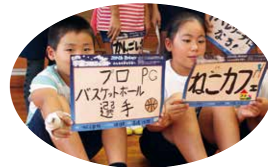
【みんなの夢は何か】