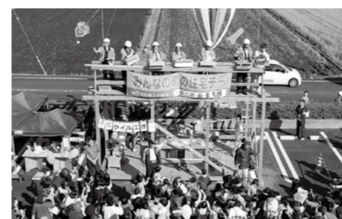
【上棟式は2回行われます】

午前 9時30分 開会式 午前10時 ミニ上棟式(祝もち投げ)、展示・即売等開始 午前10時30分 つきたて餅の配布 午前11時 怒涛いなさ太鼓ライブ 午前11時30分 ダンス披露 午後 0時30分 一宮商業高校ホール発表 午後 1時 怒涛いなさ太鼓ライブ 午後 1時30分 ラジコンヘリ展示飛行 午後 2時 つきたて餅の配布 午後 2時30分 ミニ上棟式 終了