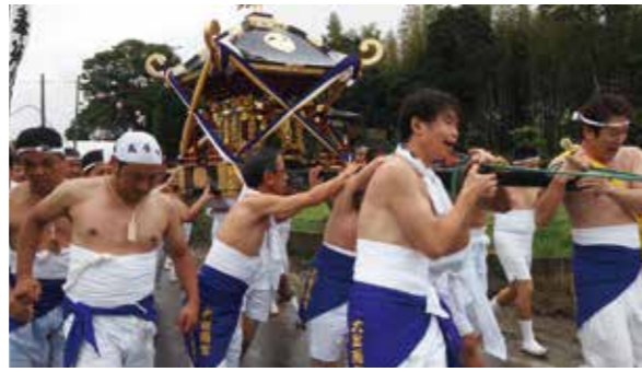
【威勢よく大宮南宮神社を出発】

9月13日、上総十二社祭りが行われました。 この祭りは県の無形文化財にも指定されており、長生村では金田の大宮南宮神社から神輿が出発、神の道を通り、釣ヶ崎海岸の祭典場に到着しました。 祭典場には、他の神社から出発した合計9基の神輿が合流し、一斉差上げ、鳥居くぐりが行われました。祭典場は、一目見ようとする観客で溢れていました。