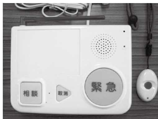
【機器本体とペンダント】