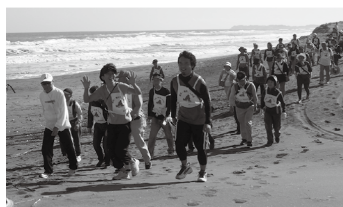
【去年の海を歩こう大会の様子】