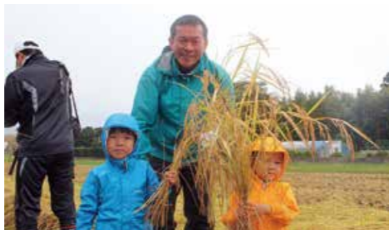
【稲穂を持ってポーズ】