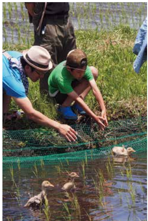
【アイガモオーナーによる放鳥】

また、5月13日には、高根保育所の園児によるアイガモの放鳥が行われました。園児たちは、元気なアイガモたちにてこずりながらも、無事に放鳥を行いました。