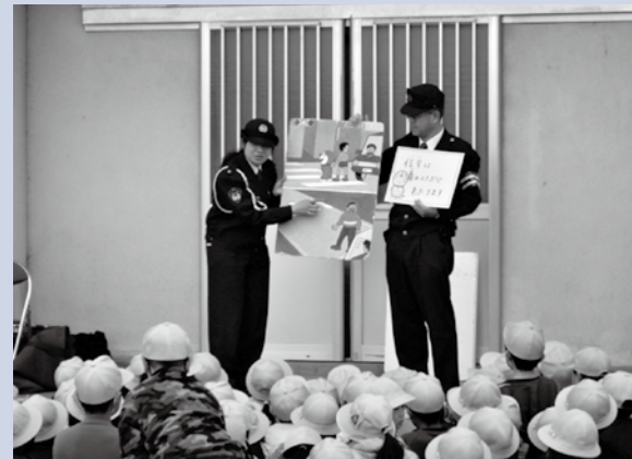
【警察の人から説明を聞きました(高根小)】