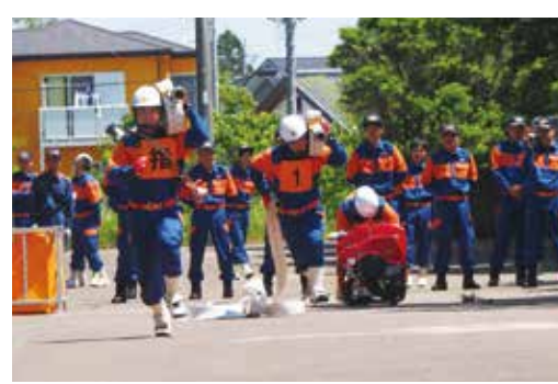
【昨年の操法大会の様子】

6月5日(日)に尼ヶ台総合公園で、第36回第六支団(長生村)消防ポンプ操法大会が、6月26日(日)同じく尼ヶ台総合公園で第35回長生支部消防操法大会(郡大会)が開催されます。 地域で活躍する消防団員の日ごろの訓練の成果をぜひご覧ください。 なお現在第六支団では、新入団員を募集しています。入団に関しては、総務課消防防災係までお問い合わせください。