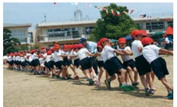
【力を合わせて綱を引きました】