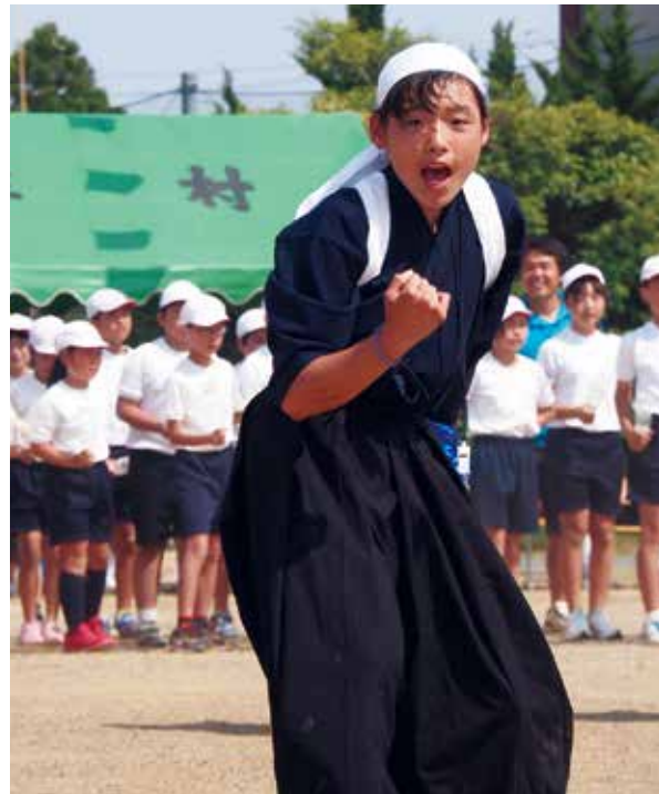
【気合の入った応援合戦】

特に、応援合戦は団長を筆頭に紅白両チームで、文字通り心を一つにしたパフォーマンスが行われました。今年には応援合戦で白組が、総合優勝は赤組でした。