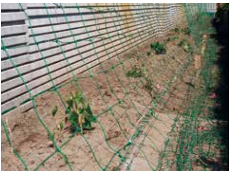
【夏にはグリーンカーテンに育ちます】

グリーンカーテンは直射日光を遮り、建物の温度上昇の抑制や、葉が水分を蒸散させることで、空気の熱を奪う効果もあります。