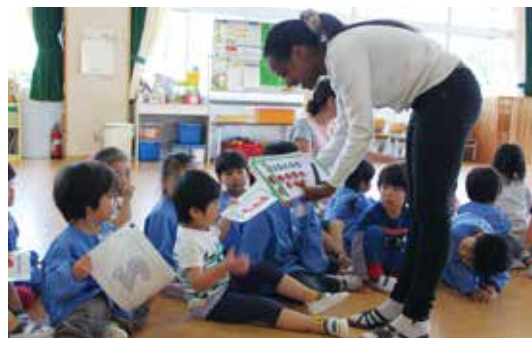
【カードを使って数字の勉強（高根保育所）】