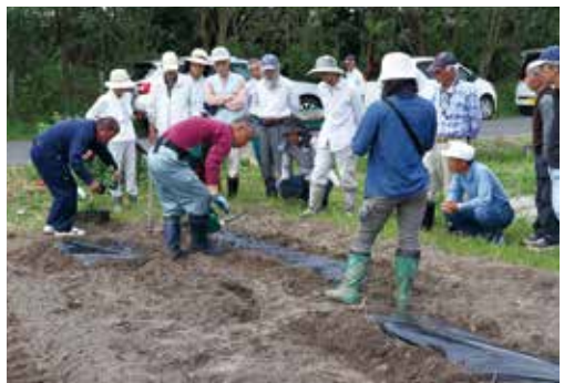
【実演を熱心に見ていました】

参加者は、定植実演を見た後にも、水やりや追肥の方法などについて、熱心に質問をしていました。