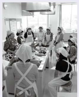
【講師の説明を聞きました】

生命維持のための血中カルシウム量は、常に一定の濃度に保たれているので、摂取するカルシウムが不足すると血中カルシウムが少なくなり、これを補うため骨の中のカルシウムが血液中に溶け出します。その結果、骨に「ス」が入ったようになり骨の量が減っていき、骨の健康を保つためには、体内でのカルシウムの吸収率が最もよい牛乳・乳製品を毎日とることが大切