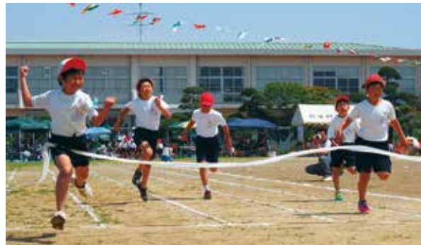
【思わずガッツポーズが出ました】