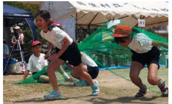
【障害を越えてゴールを目指します】