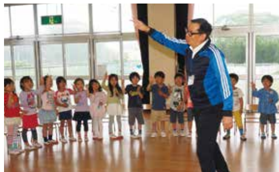
【英語で数を数えました（一松保育所）】