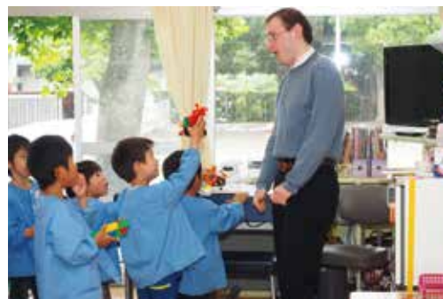
【授業以外にもふれあいました（八積保育所）】