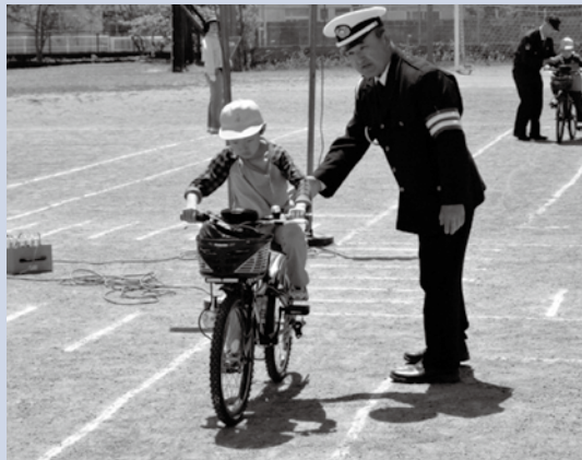
【きちんと乗れるかな(一松小)】