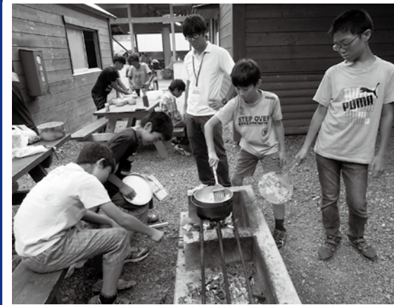
【昨年のキャンプの様子】

平成28年4月1日から3年間、第19期青少年相談員として活躍する19人が決まりました。青少年相談員とは、青少年健全育成のため、千葉県知事並びに長生村長から委嘱される有志活動者です。 主な活動として、ジュニアリーダーの育成や「夏休み子どもキャンプ大会」「子どもスキー交流会」などを開催しています。また、防犯指導員として毎月2回、夜間の「防犯パトロール」を実施しています。 これから、このメンバーでさまざまな活動を行いますので、ご協力をお願いいたします。