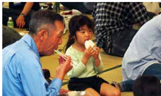
【アイガモ農法のお米のおにぎりで昼食】