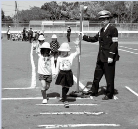
【横断歩道の渡り方を徒歩の場合と自転車の場合それぞれ教わりました(八積小)】