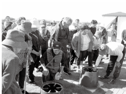
【昨年行われた防災訓練】

そして自主防災組織の立ち上げ、発展にさらに力を入れ、自分たちの命は自分たちで守る「自助」、地域の安全は地域で守る「共助」の理解を深めていただき、住民一体となった災害対策を進めてまいります。