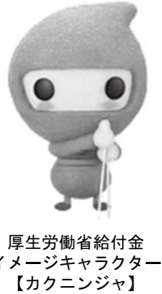
厚生労働省給付金イメージキャラクター【カクニ】

○平成29年3月31日までに65歳以上になる人（昭和27年4月1日以前に生まれた人） ○平成27年度の臨時福祉給付金の対象者（次のすべての条件にあてはまる人） ・平成27年度の住民税が課税されていない ・扶養に入っている人は、扶養主が課税されていない