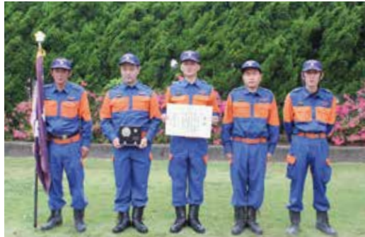
【優良賞 第2分団第5部】