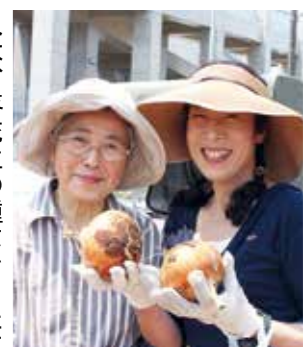
【たくさんのおもねぎに大満足】

人は、落花生の種まきとたまねぎの収穫体験を行い、落花生の種まきでは、慣れない作業を組合員のアドバイスを受けながら、丁寧に行っていました。 秋には、今回植えた落花生の収穫祭が行われる予定です。