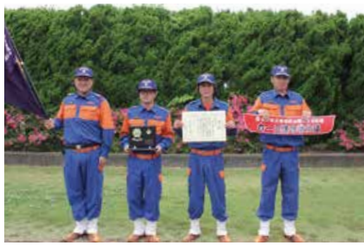
【最優秀賞 第1分団第3部】

小雨の降る悪条件の中でしたが、参加した選手たちは日ごろの訓練の成果を披露しました。