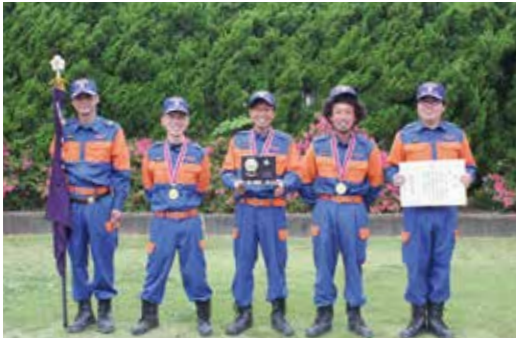
【優秀賞 第1分団第5部】