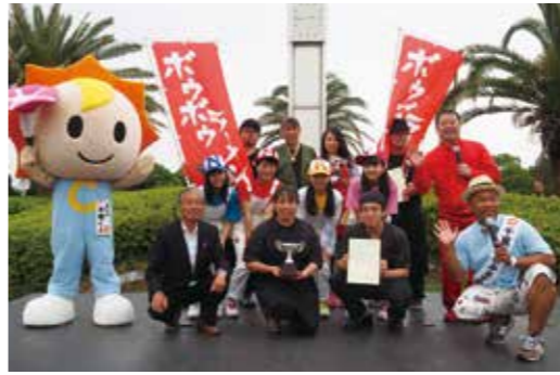
【上位3チームで記念撮影】

の「優勝ひれかつサンド」、2位が「ポウポウラーメンたかやま（茂原市）」の「ポウポウラーメン赤」、3位が「割烹湖月（長生村）」の「ながいきタンタン麺」でした。