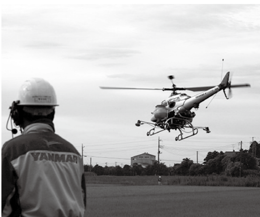
【ラジコンヘリによる農薬散布の様子】