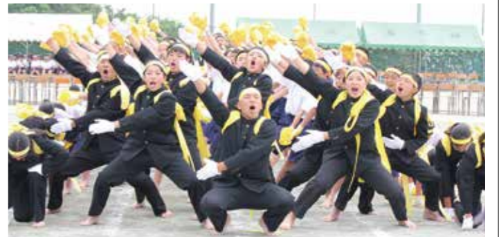
【気迫あふれる応援合戦】