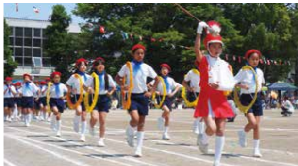
【華やかな鼓笛パレード】