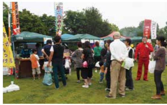
【各店舗とも長蛇の列ができていました】

5月28日、尼ヶ台総合公園で「第3回C1グランプリ」が開催され、長生地域から飲食店21店が集まり、自慢の料理でその腕を振りました。飲食店以外にも、直売所による特産品や地元農家の農産物の販売や、お笑い芸人、ご当地アイドルによるステージイベントなども行われ、会場に集まった3000人のお客さんを楽しませていました。今年はグランプリに「とんかつ串揚げ優勝（茂原市）」