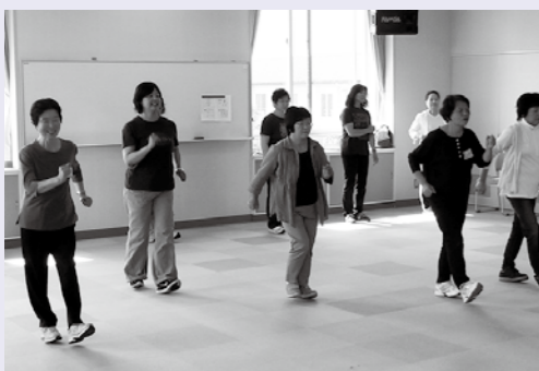
【正しい姿勢でウォーキング】

正しいフォームを意識して歩くように心がけましょう。ウォーキングの前には、ストレッチを十分に行いましょう。