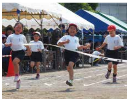
【全力で走りました】

5月21日、八積小学校で春季大運動会が晴天のもと開催されました。今年はいつかみ取れ優勝という名の希望の旗を」をテーマに掲げ、赤白に分かれ各種目で熱戦が繰り広げられました。今年の結果は、総合優勝が赤組でした。