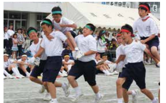
【接戦が繰り広げられました】

5月28日、「百花繚乱〜咲き誇れ英雄たち〜」をテーマに、長生中学校の体育祭が行われました。各種目で生徒たちは、競技に応援に全力で戦いました。特に応援合戦では、各団ごとに個性豊かなものとなり、団結力と気迫に溢れていました。結果は、応援合戦、色別リレーでは赤組が、総合では緑組が優勝しました。