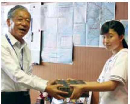
【村長に手渡しました】

長生中学校で生徒会が主体となって、平成28年熊本地震義援金が集められました。 集まった義援金は4万201円になり、6月29日に村長に手渡されました。 この義援金は役場から、熊本県健康福祉政策課義援金担当へと、7月1日に送金させていただきました。