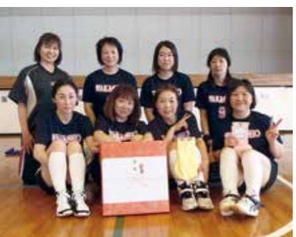
【優勝した「明るい若潮」チーム】

6月18日、体育協会主催の村民親善バレーボール大会が長生村体育館で開催されました。大会は、8チームが参加し、白熱した試合が展開されました。 結果は次のとおりです。 優勝 明るい若潮 準優勝 高根小PTA