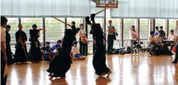
【熱戦が繰り広げられました】

6月25日、長生村体育館において第41回長生村剣道大会（長生村体育協会主催）が開催されました。大会には白井市や成田市など遠方の中学校を含む46校425人の中学生剣士が参加し、熱戦を繰り広げました。 予選リーグを勝ち抜いた男子14校、女子11校で決勝トーナメントを行いました。長生中学校は男女共に惜しくも決勝トーナメント進出を逃しま