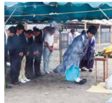
【海の安全を祈願しました】

7月15日、一松海岸で海水浴場開きの式典が行われました。式典では関係者たちが集まり、一同で海水浴期間中の海の安全を祈願しました。今年の海水浴場の開設期間は7月15日から8月21日の38日間になります。