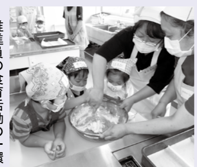
【材料を混ぜて生地を作ります】

推進員の食育活動の一環として、毎年恒例の村内保育所年長児を対象としたちびっこクッキングを実施しました。この教室は各保育所ごとに行い、子どもたちが5〜6人のグループに分かれてクッキング。