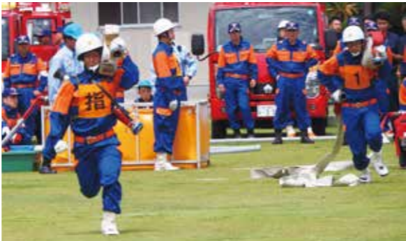
【全力疾走しました】

6月26日、第35回長生支部消防操法大会が、尼ヶ台総合公園を会場に行われました。 大会はポンプ車操法で6部と、小型ポンプ操法12部の18部が参加し行われました。 長生村からは、第2分団第5部と第3分団第3部が、小型ポンプ操法の部に出場しました。