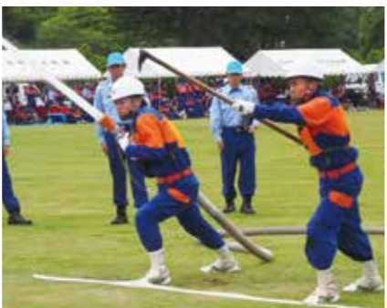
【放水を行っての演技】

6月26日、第35回長生支部消防操法大会が、尼ヶ台総合公園を会場に行われました。 大会はポンプ車操法で6部と、小型ポンプ操法12部の18部が参加し行われました。 長生村からは、第2分団第5部と第3分団第3部が、小型ポンプ操法の部に出場しました。