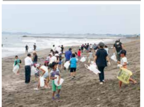
【みんなで海岸をきれいにしました】

7月9日、海水浴シーズンに先駆けて、一松海岸で一松小学校の児童と保護者、教職員による海岸清掃が行われました。 清掃作業の途中で雨も降ってくる悪条件の中でしたが、参加したみなさんは、ごみ袋がいっぱいになるまでゴミを拾い、見違えるようなきれいな海岸になりました。