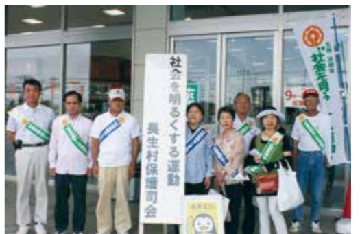
【運動に参加したみなさん】

犯罪や非行が生まれるのは地域社会であり、また、罪を償い、改善更生を果たす場も地域社会にほかなりません。安全で安心して暮らせる地域社会を実現するためには、地域社会の多くの人々の理解と協力が必要不可欠です。 長生村保護司会と長生村更生保護女性会では、7月16日にペイシアで街頭啓発活動を行いました。