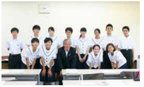
【結団式で村長と一緒に】

7月9日、白子町役場で、「中学生海外交流研修事業」の派遣団結団式が行われ、長生村、白子町、一宮町の中学生28人が集まりました。 長生中学校からは12人が参加し、今年7月31日からオーストラリアのリデイクリークでのホームステイをはじめ、ゴールドコースト、ブリズベンの視察など、8月9日までの10日間の研修会が行われます。