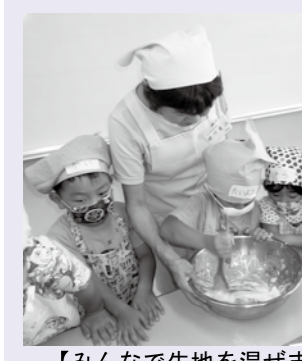
【みんなで生地を混ぜました】

推進員が袋詰めをして、おうちを持って帰れるようにしました。家では、作っている様子など話しながら、家族みんなでクッキーを食べていただきました。