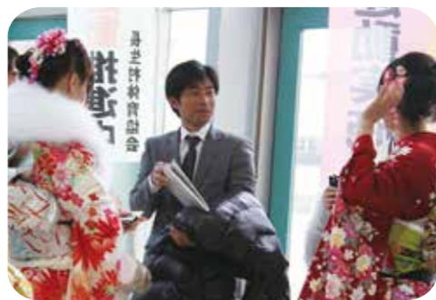
【中学時代の恩師と再会】