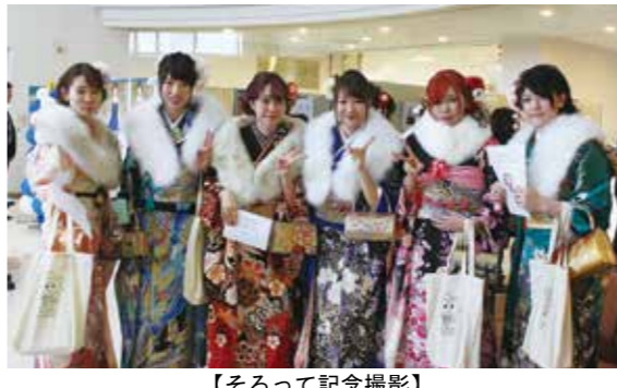
【そろって記念撮影】

お礼の言葉では、今まで育ててくれた親や、周囲の人たちへの感謝の気持ちと、新たに大人の仲間入りをしたこと