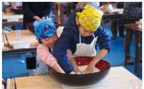
【力を合わせてそば粉をこねます】