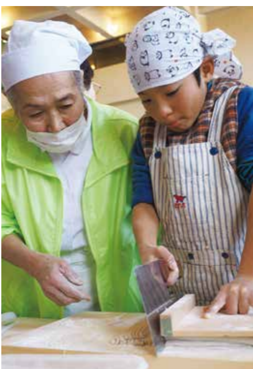
【講師に教わりながらそばを切りました】