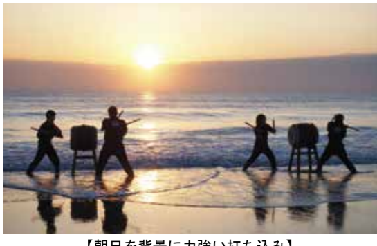
【朝日を背景に力強い打ち込み】

厳しい寒さの中でしたが、集まった人たちは、力強い太鼓の音色を聴きながら、記念写真を撮ったり、昇る朝日に新年の無事を祈るなど、それぞれに新たな年を迎えています。