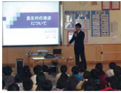
【津波に関する説明を聞きました】