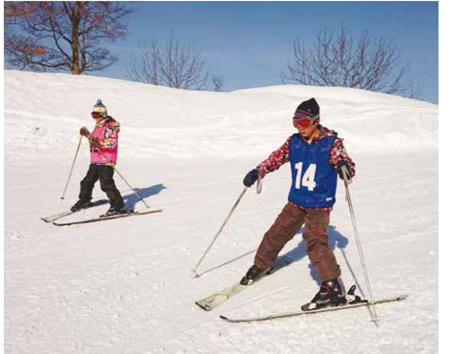
【晴天のもとスキーを満喫(スキー交流会)】