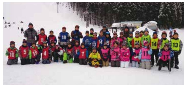
【参加者全員で集合(スキー交流会)】

また、宿泊先での団体生活やレクリエーションを通して交流を深め、新しい友達ができるなど、子どもたちにとって思い出に残るものとなりました。