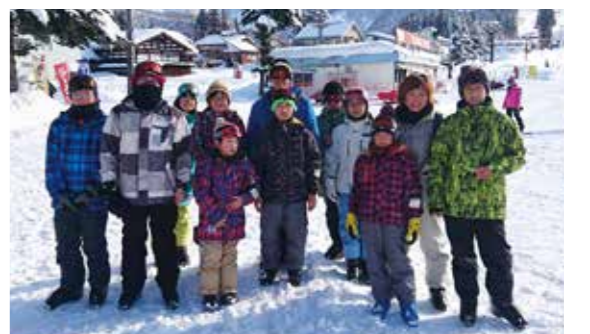
【参加した親子のみなさん(スキー体験教室)】