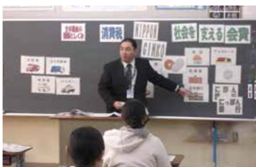
【税務課職員の説明を聞きました】

村内の各小学校で、役場税務課職員による租税教室が行われました。租税教室は、6年生を対象に行われており、税金について理解を深めてもらうことを目的としています。児童たちは、税金についてのDVDを見たり、職員の説明を聞いて、税金の仕組みやその大切さについて学びました。