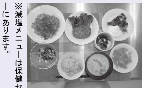
【完成した減塩メニュー】

調理実習では1食分の塩分を3g以下に抑えたメニューを作り試食しました。薄味だと物足りないと感じやすいですが、食べ方や作り方の工夫で上手に減塩できます。 ○減塩するポイント ①柑橘類の酸味やさわやかな香りを活かす ②香辛料・香味野菜を利用する ③天然食品でだしを取り「うま味」を活かす ④旬の食材を選ぶ ⑤調味料に含まれる塩分量を知っておく