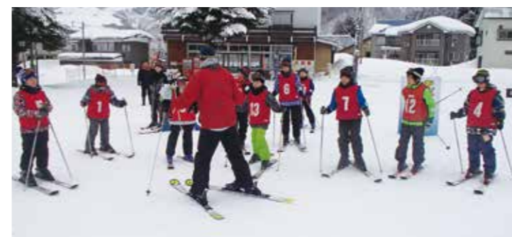
【インストラクターの指導を受けます(スキー交流会)】