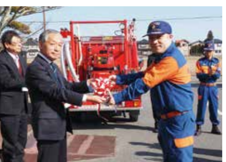
【部長に鍵が渡されました】

2月16日、役場庁舎前で平成28年度小型ポンプ付積載車引渡式が行われました。今年、第6支団第1分団第4部(岩沼地区)の消防団へ、長生郡市消防本部から、新しい消防車が引き渡されました。引き渡しを受けた団員たちは、地域防災への思いを新たに誓うとともに、早速放水の訓練をしました。