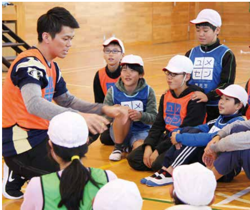
【ゲームの内容を説明】

村内の各小学校で、役場税務課職員による租税教室が行われました。租税教室は、6年生を対象に行われており、税金について理解を深めてもらうことを目的としています。児童たちは、税金についてのDVDを見たり、職員の説明を聞いて、税金の仕組みやその大切さについて学びました。