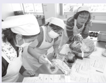
【塩分測定を行っています】

研修会では、まず塩分測定器を使って各自持参したみそ汁の塩分測定を行い、我が家の汁物にどのくらいの塩分が含まれるか確認しました。