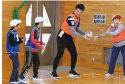
【先生と一緒にゲームを行いました】