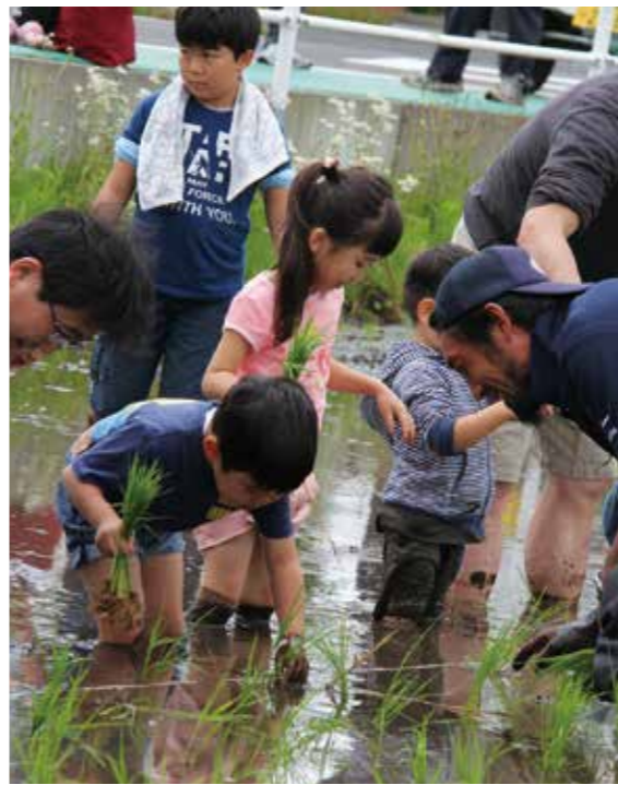
【泥にまみれながらの田植え体験】