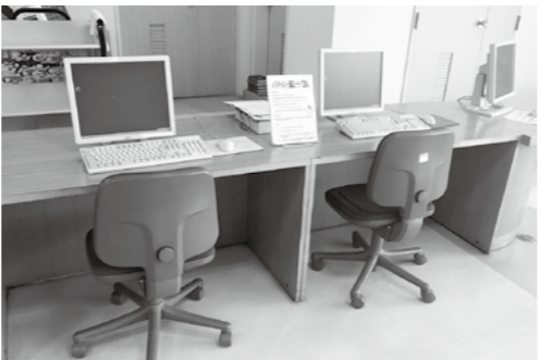
【インターネット用のパソコン】