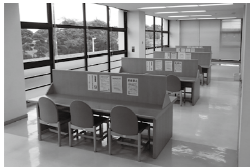
【ルールを守って利用しましょう】

開室時間 午前8時30分～午後5時 休室日 毎週月曜日、祝日の翌日、 年末年始、蔵書点検期間 問い合わせ 生涯学習課（文化会館） ☎（32）5100