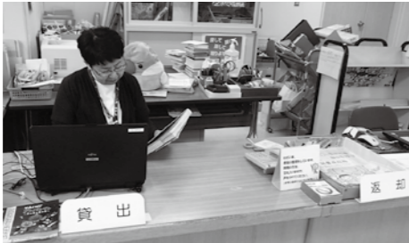
【受付にご相談ください】

探している本が見つからないときや、どの本で調べればいいのかわからないときは受付にご相談ください。