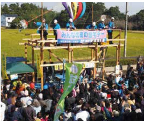
【昨年の産業まつり】

前にご相談ください。 出展料 ・ 産業まつりの部 物販（飲食） 3千円 フリーマーケット 千円 ・ C1グランプリの部 5千円 参加条件 ① 酒類の販売は禁止します。 ② 飲食物を販売する場合は、必ず保健所に申請してください。 ③ 調理などで火を取り扱う場合は必ず消火器を用意してください。