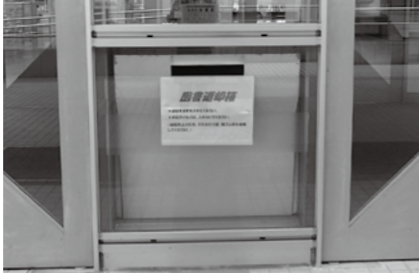
【正面玄関の返却ポスト】