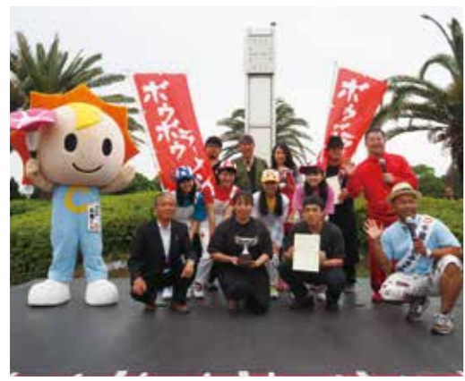
【昨年のC1グランプリ】

第31回長生村産業まつりを11月4日（土）に開催します。今回から会場を「尼ヶ台総合公園」に移し、例年5月末に開催していた「C1グランプリ」（長生地域うまいもの決定戦）も産業まつりのイベントとして開催します。