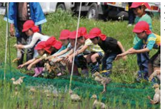
【オーナーによるアイガモ放鳥】