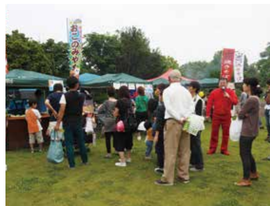
【昨年のC1グランプリ出展の様子】

を貸し出します。長生地域のうまいものナンバー1を目指したいという出展者のお申し込みをお待ちしております。 と き 11月4日（土） 午前9時30分～午後2時30分 予備日 5日（日） ※C1グランプリは午前10時～午後2時を予定。 ところ 尼ヶ台総合公園 出展者募集しています 産業まつりでは長生村内に事業所・店舗等をおく企業、団体、個人事業者のほか、学校、クラブ、友人同士の団体、また個人での出展も可能です。 C1グランプリについては、主に長生郡市内の農林畜水産物生産者、食品加工業者、農産品販売、飲食料品店、小売業等を募集しています。ただし、内容が産業まつりの趣旨に添わないものにつきましては、出展ができない場合がありますので事