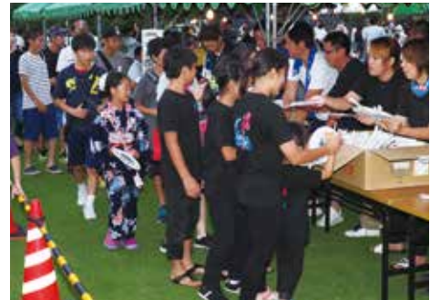
【うちわが配布されました】