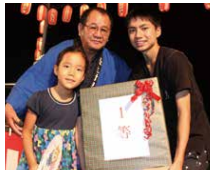
【1等が当たりました】