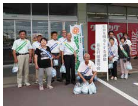
【運動に参加されたみなさん】

7月23日に、保護司会と更生保護女性会のみなさんによる街頭啓発運動が、ベイシア長生店で行われました。 この運動は、犯罪や非行のない安全・安心な地域社会を築くことを目的として行われています。