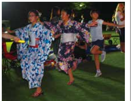
【踊りコンテストに出場した小学生チーム】