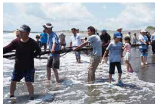
【みんなで網を引きました】

7月から8月の海水浴場の開設期間に合わせて、一松海岸で長生村観光協会主催の観光地曳網が開催されました。今年は、天候により7月21日の一回だけの開催となりましたが、お客さんで賑わいました。力を合わせて引き上げた網には、たくさんのお魚が入っており、参加者全員にプレゼントされました。