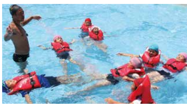
【服を着たまま泳ぐのは意外に難しいです】