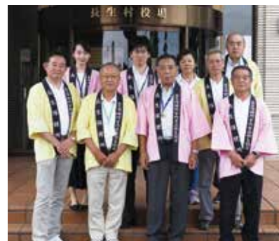
【パレードに参加されたみなさん】

8月3日、食中毒に対する注意を呼びかけるための、食中毒予防パレードが行われました。 長生地区の食品衛生協会、食品衛生指導員、保健所職員が参加し、食中毒に対する注意喚起が行われました。