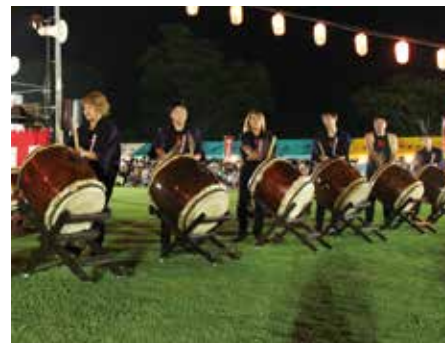
【怒涛いなさ太鼓による迫力の組打ち】