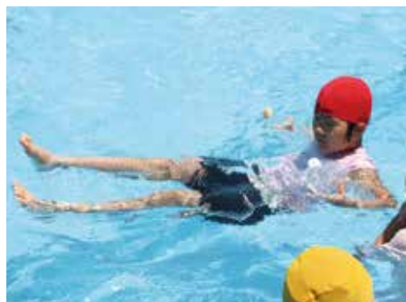
【ペットボトルの浮き具を体験】

7月に村内の3小学校で、水泳授業の一貫として着衣水泳が行われました。着衣のまま水に落ちてしまった時、体の重さはどのような状況になってしまふのか、緊急の対応方法を児童たちは教わりました。また、実際に水の中でペットボトルを浮き具として活用できることを体験しました。