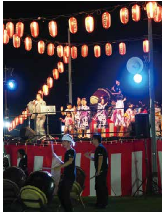
【曲に合わせてやぐらの上で踊りました】