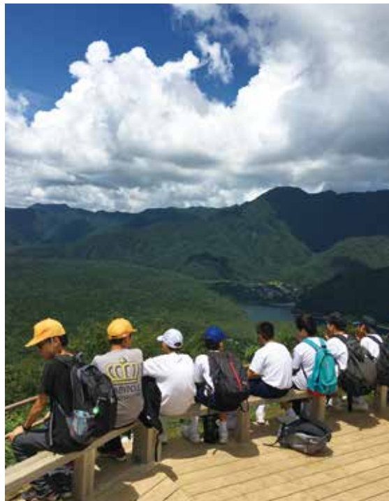
【頂上からの眺めは最高でした】