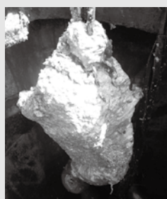
油脂が付着したポンプのスイッチ

から水に溶けないものを流すと排水管が詰まって汚水が溢れたり、処理施設の機能を低下させる原因となります。また、油を流すと下水道管の中で固まって、つまりや悪臭の原因になります。