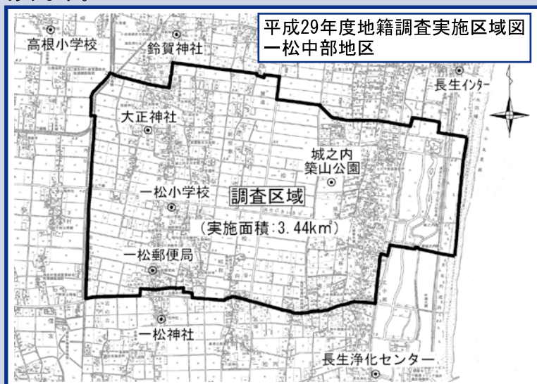
平成29年度地籍調査実施区域図 一松中部地区