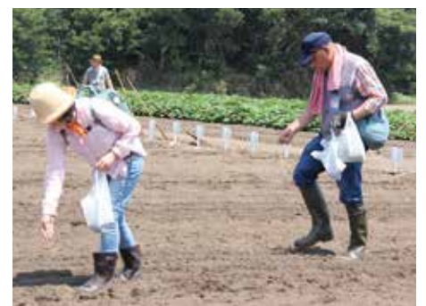
【願いを込めて種をまきます】

オーナーのみなさんは、熊手と種を持ち、種まきと枝豆の収穫をし、昼食には手打ちのそばを食べました。今後はかかし作り、刈取り、そば打ち体験が開催される予定となっています。