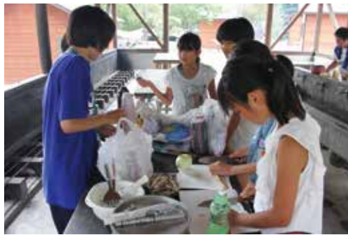
【協力して食事の準備】