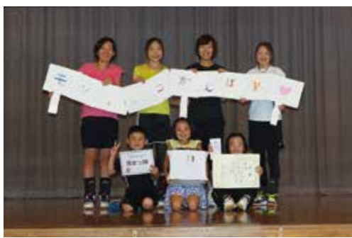
【茂女っ娘チームのみなさん】

10月1日、長生村体育館で長生村スポーツ推進委員主催による「第1回ながいきむらスポレク祭」が開催されました。 競技は、タッチバレーボールとグラウンドゴルフの2種目で、大人から子どもまで一緒に楽しんで、元気と笑顔いっぱい競技を楽しみました。 各競技での結果は次のとおりです。