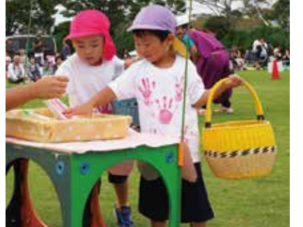
【きちんとお使いできたかな】