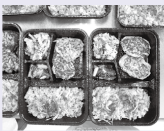
【完成した減塩メニュー】

今回入山津のみなさんにお弁当を提供するのは初めてでしたが、とても喜んでいただき、今後の活動の励みになりました。