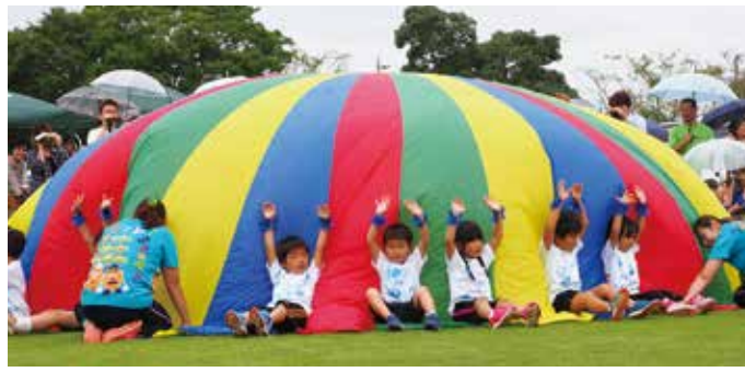
【バルーンがきれいに膨らみました】

9月16日、尼ヶ台総合公園で八積、高根、一松の3保育所合同の運動会が開催されました。 園児たちは、徒競走やダンス、バルーンなど日ごろ練習してきた成果を披露。 悪天候により、一部の競技ができませんでしたが、元気いっぱいの運動会となりました。