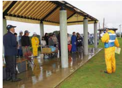
【避難施設についての説明を聞きました】

10月15日、地震・津波避難訓練が、村内全域で行われました。 当日は、悪天候でしたが、約1600人が参加し、避難経路の確認や、避難施設での名簿の作成、役場職員からの避難施設の備品についての説明を受けました。 また、一松小体育館では、消防職員による救急救命の講習会も行われました。緊急時の心臓マッサージや、AED