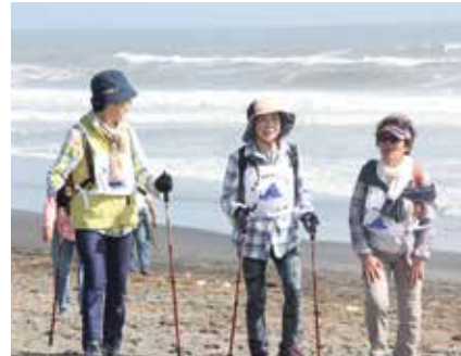
【潮風を浴びながら歩きました】

10月8日、長生村体育協会主催による「第12回長生・海を歩こう大会」が開催されました。286人の参加者は、一松海岸を出発し、白子町の中里海岸までの往復3kmを約1時間かけて歩きました。 完歩後は、トマトや味噌汁の無償配布、農産物が当たる抽選会を楽しんでいました。