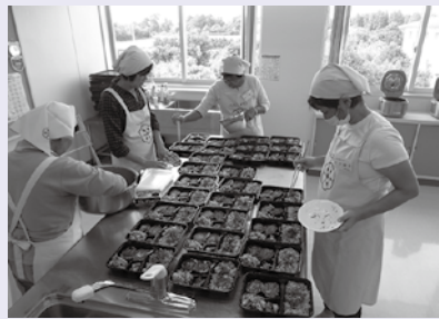
【協力して料理を作っています】

介護予防のための体操を、1時間半行ったあと、高齢者の食事について手ばかり栄養法を使って話させていただきました。減塩メニューの試食を召し上がっていただきました。