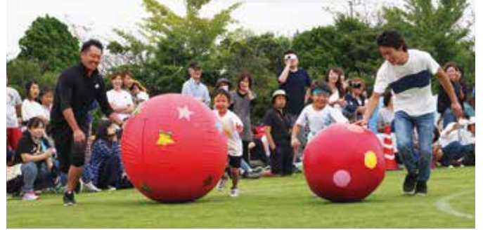
【親子で力を合わせてがんばりました】