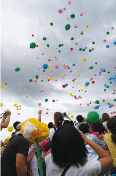
【最後にバルーンリリースを行いました】