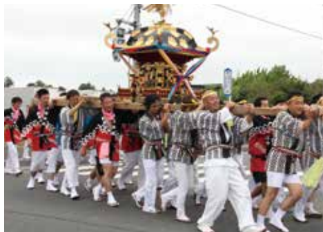
【迫力の大人神輿(住吉神社秋季例大祭)】

○住吉神社秋季例大祭 9月23日、住吉神社で秋季例大祭が行われました。子どもと大人の2基の神輿が威勢よく出発し、高根地区を練り歩きました。 ○鈴鹿神社祭礼 10月1日、鷲地区で鈴鹿神社祭礼が行われ、万灯(まんどろ)とお囃子などの列が地区内を練り歩きました。