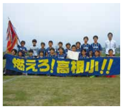
【優勝した高根小チーム】

10月11日に長生郡市小学校球技大会が開催されました。長生村からは、サッカーの部には一松小、高根小が、ミニバスケットボールの部には八積小、高根小が地区予選を勝ち抜いて出場しました。サッカーの部では、決勝に進んだ高根小が延長戦の末、