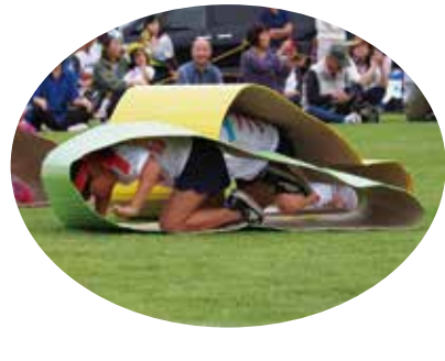
【前が見えずに悪戦苦闘】