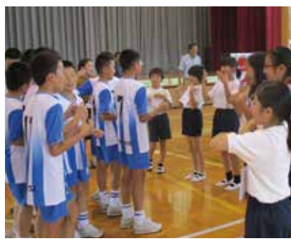
【ゲームによるコミュニケーション】

10月12日、一松小学校へ中国から中国人民大学付属小学校などの小学生30人と中学生30人が来訪しました。 一松小の5、6年生の児童たちは、英語を使ってお互いの挨拶や、数の教え方を紹介したり、楽しくゲームをして交流を深めました。