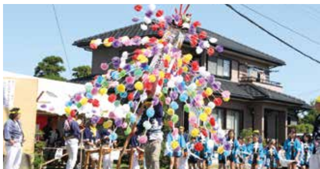
【万灯が練り歩きました(鈴鹿神社祭礼)】

○住吉神社秋季例大祭 9月23日、住吉神社で秋季例大祭が行われました。子どもと大人の2基の神輿が威勢よく出発し、高根地区を練り歩きました。 ○鈴鹿神社祭礼 10月1日、鷲地区で鈴鹿神社祭礼が行われ、万灯(まんどろ)とお囃子などの列が地区内を練り歩きました。