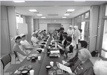
【みんなで試食を行いました】

今回入山津のみなさんにお弁当を提供するのは初めてでしたが、とても喜んでいただき、今後の活動の励みになりました。