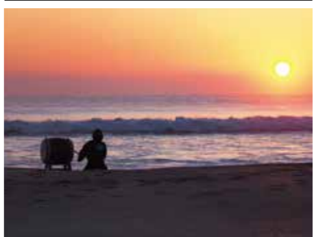
【太鼓の音が響き渡りました】

集まった人たちは、太鼓の力強い音色を聴きながら、昇る朝日に新年の無事を祈りました。