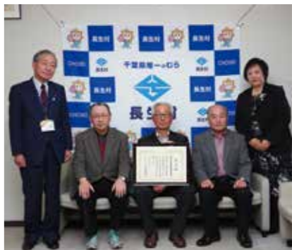
【校長と共に村長に報告】

11月10日に行われた、第56回千葉県交通安全県民大会において、高根小学校の「交通安全推進隊」が交通安全優良団体として千葉県教育委員会から表彰されました。交通安全推進隊は、高根小学校児童の登下校の際に、交差点などでの交通安全見守り活動を長年行っており、その功績により今回の表彰となりました。