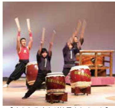
【迫力ある演奏が披露されました】

12月17日、文化会館ホールで「和太鼓コンサート絆2017」が開催されました。和太鼓の演奏以外にも、特別出演者によるショーなどもあり、会場は大変盛り上がりしました。