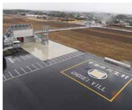
【長生分署の北側になります】

人命救助の迅速化を図るため、消防本部長生分署の隣接地に整備が進められていたヘリポートが完成しました。ドクターヘリの緊急離着陸場として、12月26日から運用を開始しています。