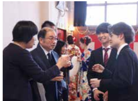
【中学時代の恩師と再会】