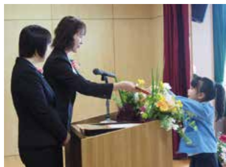
【証書が手渡されました(高根保育所)】