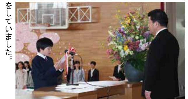
【新入生代表誓いの言葉(長生中学校)】