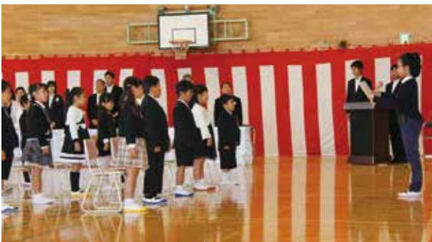
【在校生代表の歓迎のこたば(一松小学校)】