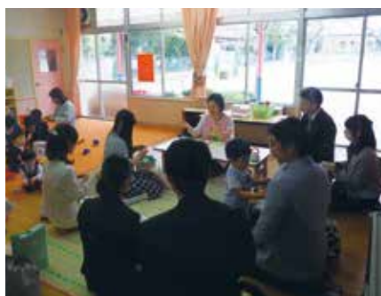
【教室で先生からの話(一松保育所)】