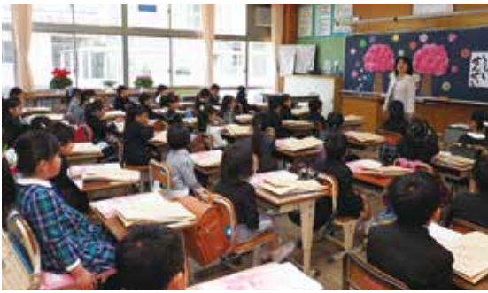
【教室で先生の話听取了(高根小学校)】