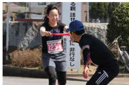
【懸命にタスキをつなぎます】