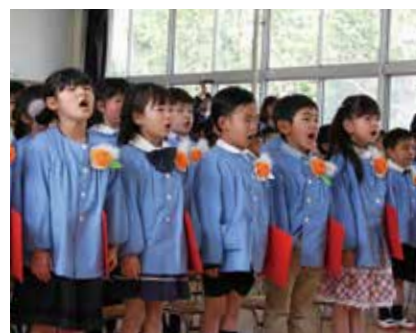
【卒園の歌を歌いました(八積保育所)】

先生たちによる花のアーチや、紙ふぶきで見送られました。 また、4月5日には入所式が行われました。新入所児たちは、担当の先生に名前を呼ばれると、元気いっぱいに返事をしていました。