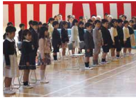
【緊張した表情の新入生(八積小学校)】