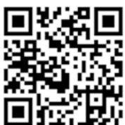
【村防災メールQRコード】

空メールを送信すると、登録用のメールが返信されますので必要事項を登録してください。迷惑メール防止機能のドメイン指定受信などを設定している場合は、空メールを送信する前に raidan.ktaiwork.jp からのメールが受信できるよう設定してください。登録完了のメールを受信できれば登録完了です。