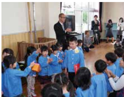
【みんなに見送られました(一松保育所)】

園児たちは、一人ひとり名前を呼ばれ、保育証書を所長から受け取りました。 式の最後には、後輩園児や