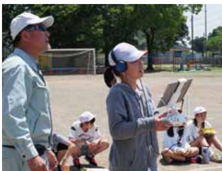
【ドローンの操縦を体験】

授業では、ドローンの性能に関する説明や、どのような業務に使われているのかなどが説明されました。また、操縦体験も行われ、代表の児童が実際にドローンの操縦を行いました。