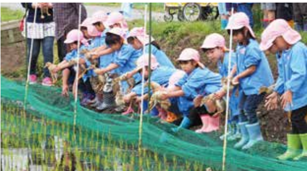
【高根保育所園児たちによる放鳥】

児たちによるアイガモの放鳥が、5月10日に行われました。園児たちは、元気なアイガモたちに苦戦しながら、無事に放鳥を行いました。