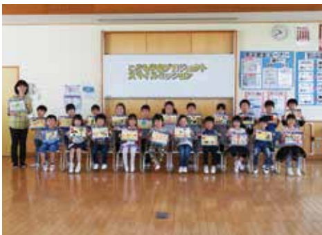
【描いた絵を手に記念撮影】

この教室は、最先端の技術を体験することで、社会の変化に目を向け、未来を作り出していける児童の育成を目的としています。