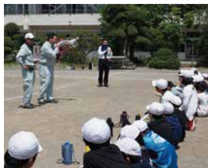
【ドローンについての説明を聞きます】

授業では、ドローンの性能に関する説明や、どのような業務に使われているのかなどが説明されました。また、操縦体験も行われ、代表の児童が実際にドローンの操縦を行いました。