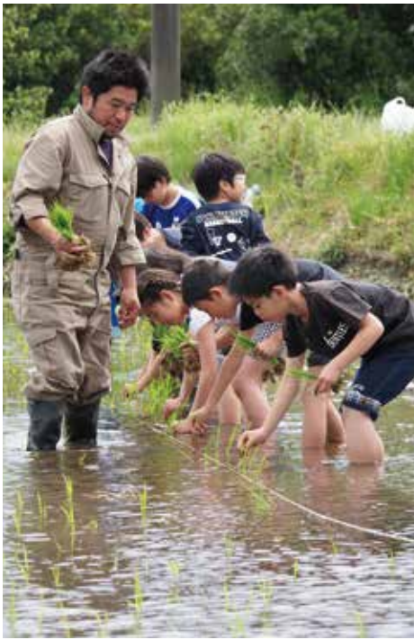
【泥だらけになりながらの田植え体験】