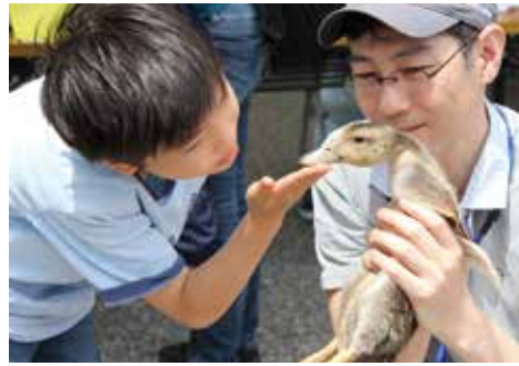
【アイガモとのふれ合い】