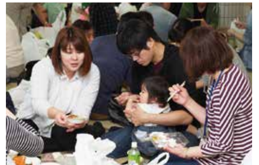
【アイガモ農法のお米で昼食】

児たちによるアイガモの放鳥が、5月10日に行われました。園児たちは、元気なアイガモたちに苦戦しながら、無事に放鳥を行いました。