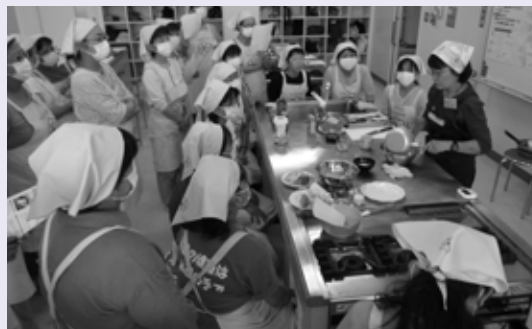
【講師による調理法の説明】

調味料として食塩は全く使いませんでしたが、チーズを出したりと乳製品を上手に取り入れることでおいしく減塩ができました。 レシピが欲しい人は、保健センターまでご連絡ください。