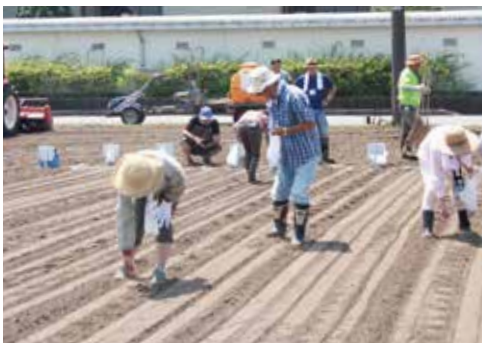
【暑さに負けずに種をまきました】

オーナーのみなさんは暑さにも負けず、畑にそばの種をまきました。また、種まき後は枝豆の収穫を行いました。収穫後は、昼食としてそばが振る舞われ、参加者たちは打ちたてそばののどごしを楽しみました。