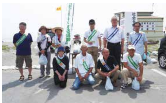
【啓発活動前に集合】

安全で安心して暮らせる地域社会を実現するためには、地域社会の多くの人たちの理解と協力が不可欠です。この運動は、犯罪や非行のない安全・安心な地域社会を築くことを目的として行われています。