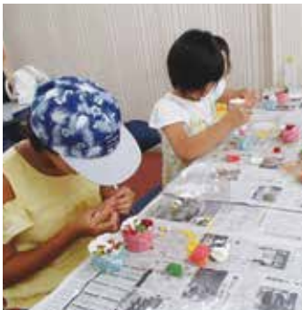
【粘土で形を作ります】

キャンプファイアーなど、自然の中で仲間とのきずなを深め、楽しい夏の思い出をつくることができました。