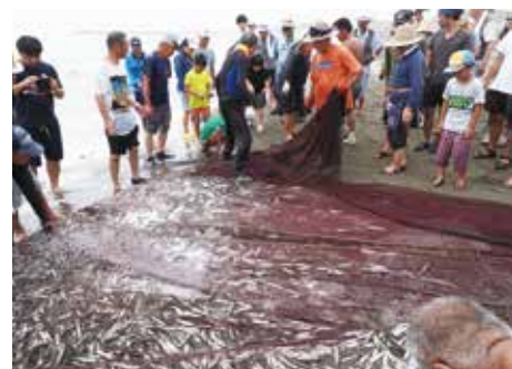
【網の中にはたくさんのお客さんの魚がいました】

当日には、たくさんのお客さんが集まり、みんなで力を合わせて網を引き上げていました。