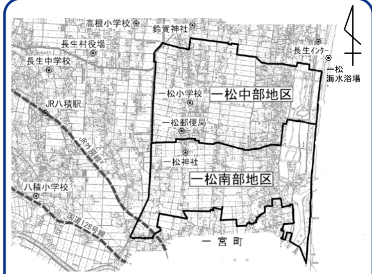
○地籍調査についてはこちらもご参照ください。 国土交通省地籍調査Webサイト http://www.chiseki.go.jp/