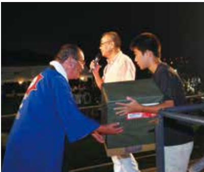
【1等の景品が手渡されました】