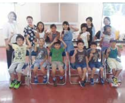
【作品を手に記念撮影】