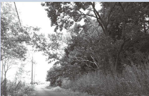
【速やかな伐採をお願いします】