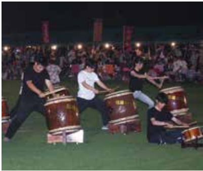
【いなさ太鼓による組打ち】