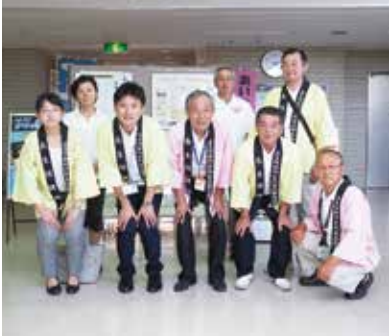
【参加したみなさん】