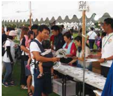
【うちわの配布にもたくさんの方が】