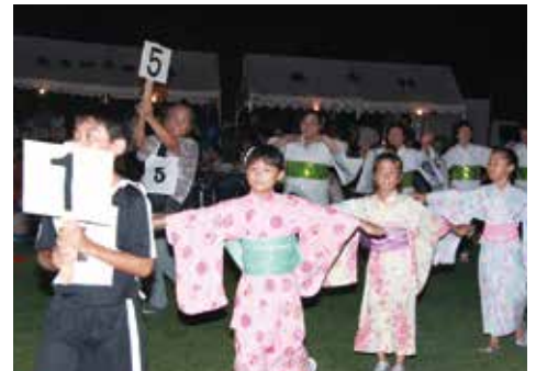
【踊りコンテストの参加者】