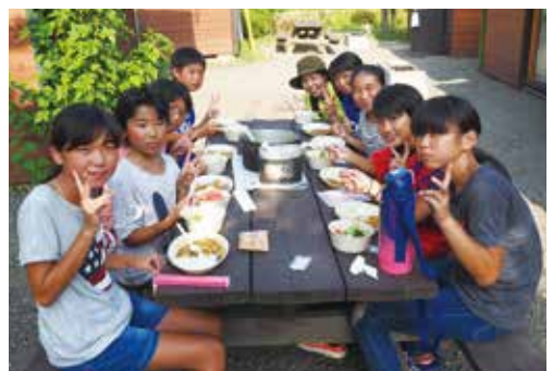
【みんなでそろっていただきます】

8月4日～6日、長生村青少年相談員連絡協議会主催によるキャンプ大会が、山梨県の西湖湖畔キャンプ場で行われ、村内小学校6年生38人、中学生ジュニアリーダー10人など総勢66人が参加しました。1日目には小高村長も参加し、夜には毎年恒例のこわい話で盛り上がりました。また、参加者は、飯盒炊きによる炊事やハイキング、