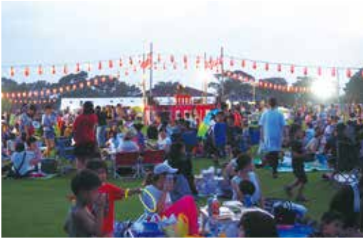
【会場にはたくさんのお客さんが訪れました】

1日目は長生音頭の踊りコンテストが行われ、小学生と一般の部あわせて10チームが参加し、工夫を凝らした衣装や振付で会場は大いに盛り上