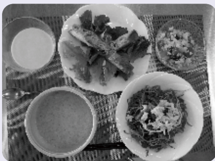
【今回の試食メニュー】

年齢を重ねるにつれ健康問題の中身も変わってきます。働き盛りの頃は、メタボリックシンドローム（メタボ）の予防が気になるころでしたが、現役を引退する頃からは、ロコモティブシンドローム（ロコモ）やフレイルの予防が重要になってきます。ロコモとは、筋肉や骨、関節といった運動器に障害がおこり、歩行や日常生活に何らかの障害をきたしている状態をいいます。フレイルは、徐々に心身が弱り、要介護に近づくことです。運動器の低下がメタボや認知症を併発することも報告されており、歳を重ねても生活機能が低下しないようにすることや活発な社会参加で人やまちとつながりを持つことも大切です。