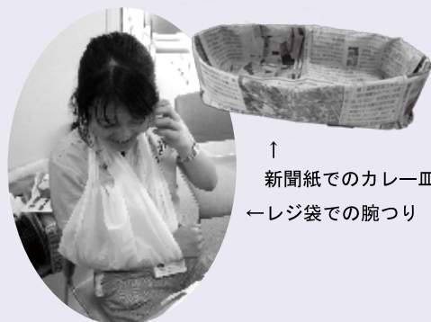
↑ 新聞紙でのカレー皿 ← レジ袋での腕つり

研修会の後半では、身近なもので災害時に役立つグッズ作りとして、ゆかいな仲間たちのみなさんにくっつか教えていただきました。新聞紙で作るスリッパ、カレー皿の折り方。レジ袋の活用方法として、レジ袋のたたみ方、レジ袋を使っての水の運び方、腕つり、おむつカバー、食食用エプロンの作り方などです。こうした知識を持っているだけで、実際に災害に見舞われた時、慌てることなく行動することができます。大変良い研修会を行うことができました。