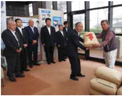
【村長が代表して受け取りました】