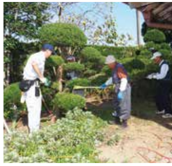
【道具を手に実習を行いました】